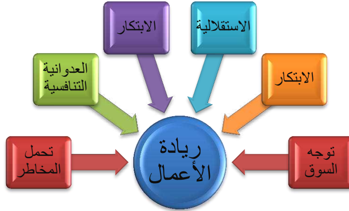
الشكل (2): أبعاد ريادة الأعمال.