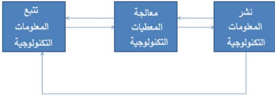
الشكل (1) مراحل اليقظة التكنولوجية.