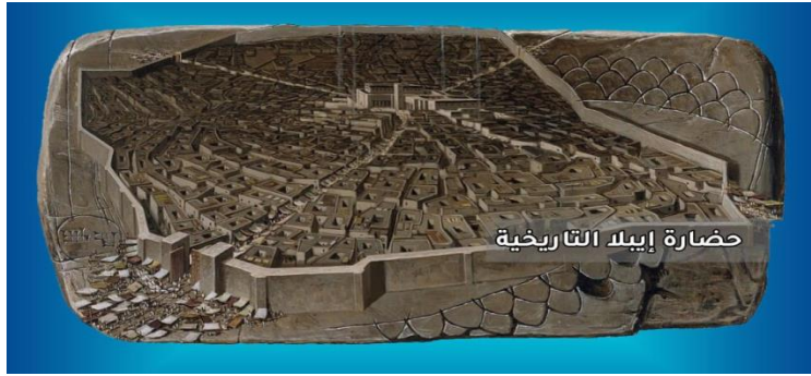
الشكل 5 مدينة إبلا (تل مردوخ)