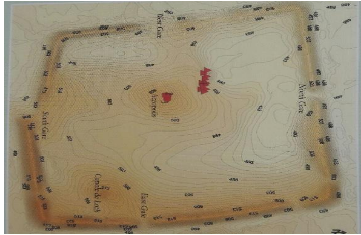
الشكل 4 تطور التحصينات في قطنة (تل المشرفة)