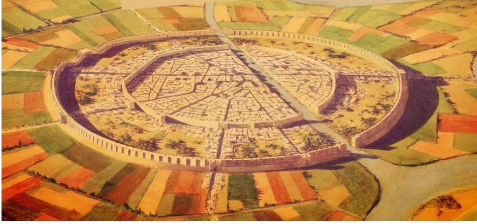
الشكل 3 التحصينات في مدينة ماري