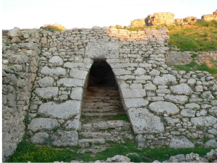
الشكل 6 البوابة الغربية في أوجاريت (رأس الشمرة)

معلومات التمويل : هذا البحث ممول من جامعة دمشق وفق رقم التمويل (501100020595).