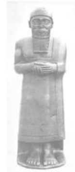
الشكل ١١: تمثال إيشوب إلوم