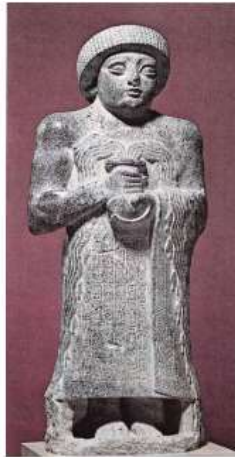
الشكل ٢٢: جوديا يحمل الإثاء الفوار . باروه ١٩٧٧، الشكل ٢٦٤.