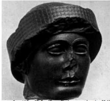
الشكل ٤: رأس جوديا يظهر القبعة التي كان يعتمرها