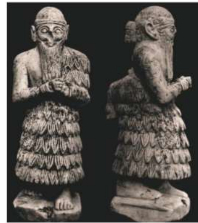
الشكل ١٧ : تمثال إنشي-ماري