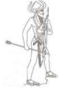
الشكل ١: نارام سين الأكدي يعتمر العونة ذات القرنين