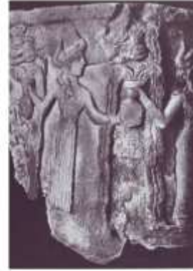
الشكل ٢١: نقش بارز على كتف من حوض حموي، يورخ بعصر جوديا موريلكوت، ١٩٧٥، الشكل ٧٨٨.