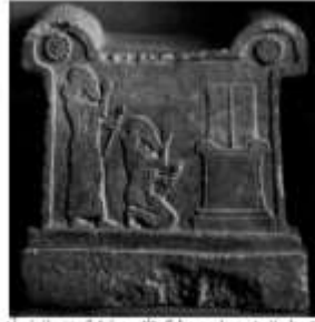
الشكل ٣١: مشهد سائرون على قاعدة مجريد بجمدة الملك الآشوري أوغزالي الأورار (٨٨٥-٨٥٥) في واحة الفوفيد والسطور. Frankfort H., 1966, pl. 73.b.