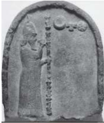
الشكل ٢٤: مسلة شوبيد Orthmann W., 1975, pl.231.