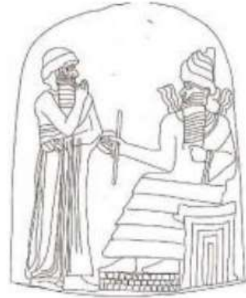
الشكل ٣: مملة الشريعة، حمورابي يعتمر قبة دائرية