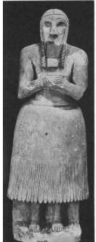
الشكل ١٥ : تمثال لمتعبد من معبد مين في الخفاجي، عصر السلالات البابلية الثانية