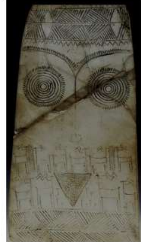
الشكل ٧: مسلة ماري Margueron J.C., 2004, fig.92