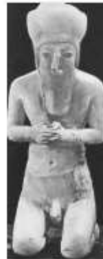
الشكل ٢٩: متجد حلي، رافع، ١٩٣٨، قوام ٥٥ Frankfort H., 1939, pl.27-a.