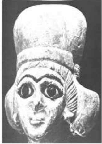
الشكل ٦: رأس كاهنة من ماري، نصف الأول من الألف الثالث ق.م. بارو، ١٩٧٧، الشكل ١٥٣.