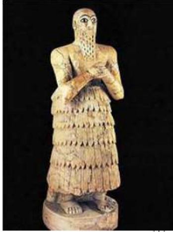
الشكل ١٠: تمثال إيكوشنماغان ملك ماري Margueron J.-C., 2004, pl.53