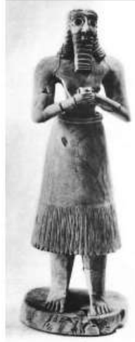
الشكل ٨: تمثال لرجل بعينين واسنيتين، تل أسمر Frankfort H., 1939, pl.1.