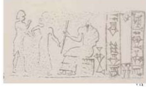
الشكل ١٣ : متول متعبد بين يدي الإله