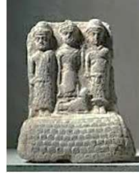
الشكل ٢٥: الزيرة عشتار تذكوس بإحدى قدميها على ظهر أسد Margueron J.C., 2004, fig. 504-2.