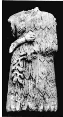
الشكل ١٨ : تمثال لمتعبد في وضعية الوقوف يحمل خصناً