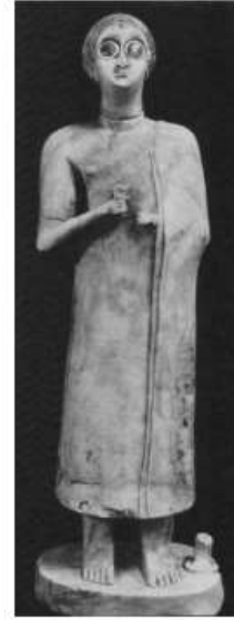
الشكل ٩: تمثال لامرأة بعينين واسنيتين، نل أسمر