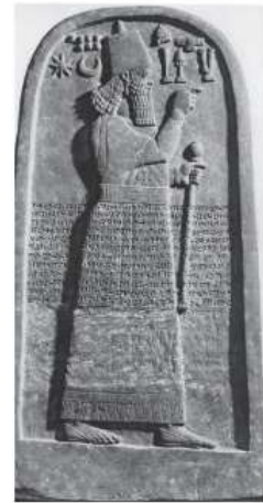
الشكل ٢٣: مسلة أند نيوراري الثالث Orthmann W., 1975, pl.212.