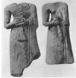
الشكل ٢٠: تماثيل من معبد سين في المغاجي - يملكان امرأتين وقتلتين تملكان خصناً Frankfort H., 1939, pl.81-a, b