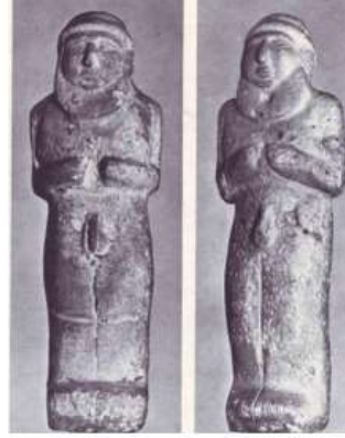
الشكل ٥: تمثالان لرجلين عاريين، عصر جمدة نصر مورنكات، ١٩٧٥، اللوحان ٦ - ٧.