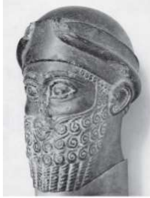
الشكل ٢: رأس بوزور عشتار