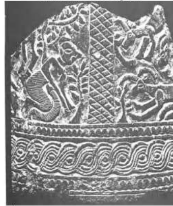
الشكل ٢٧: كسرة من آنية طقوسية تصور رجلاً رافعاً Parrot A. 1953, fig.4