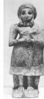
الشكل ١٦ : تمثال لمتعبد من معبد مين في الخفاجي، عصر السلالات البابلية الثانية