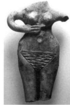
الشكل ٣٢: دمية طينية لامرأة عارية بلا رأس، وقدمين، وإحدى اليدين Weygand I, 2007, fig. 6.