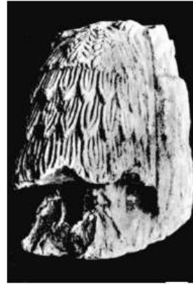
الشكل ١٩: تماثيل غير كامل لتعبّد في وضعية الجلوس يحمل خصناً Parrot A. 1935, pl.XXII-3