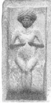
الشكل ٣٣: قالب مستطيل يحمل نقشاً يمثل امرأة عارية Parrot A., 1937, fig.13.