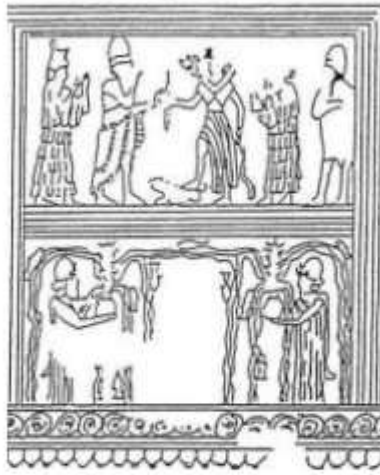
الشكل ١٢: لوحة التصويب من ماري، الإلهة لاما تظهر في أكثر من موضع ترفع يديها طلباً للشفاعة لملك ماري من الإلهة عشتار