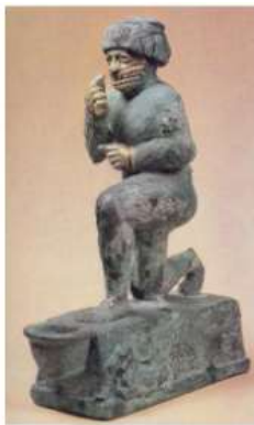
الشكل ٣٠: متجد رافع Orthmann W., 1975, pl.XI