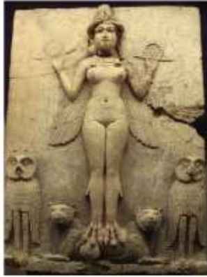
الشكل ٢٦: ليثيت ربة الموت Frankfort H., 1996, pl.56