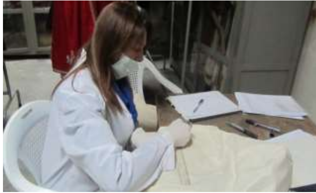
الشكل رقم (06) كتابة الرقم المتحفي للثوب الفلكلوري على الغلاف القماشي