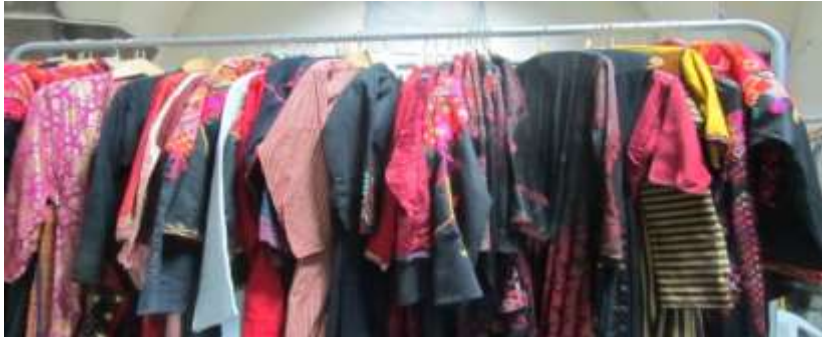
الشكل رقم (02) تجميع الأثواب الفلكلورية على هيكل معدني بعد اخلائها من القاعات

التخزين: تم تجهيز المستودعات وتنظيف أرضياتها وسقفها وجدرانها بالماء والصابون، ثم تعقيمها، وقبل نقل مجموعة الأثواب النسيجية اليها تم تجهيز الأثواب عن طريق تمرير خرطوم جهاز نفخ الغبار على كامل الثوب، ثم استخدم بعده جهاز آخر لشطف الغبار ينظر الشكل رقم 07-08.