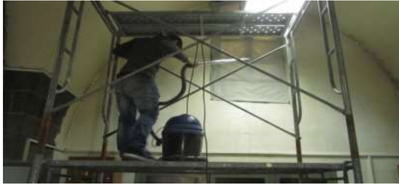
الشكل رقم (13) تنظيف جدران مستودعات متحف التقاليد الشعبية من الغبار بواسطة مكنسة كهربائية