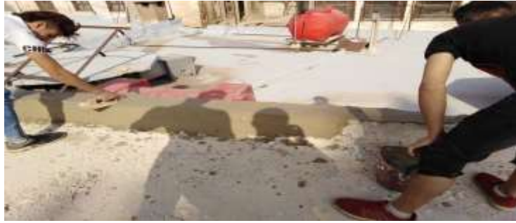
الشكل رقم (11)

اصلاح وتقوية السقف في متحف التقاليد الشعبية