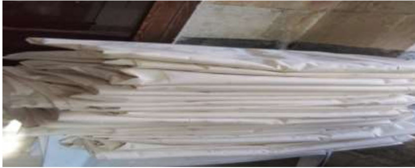
الشكل رقم (03) تجهير قماش الكتان النقي لعملية تغليف الأثواب النسيجية الفلكلورية