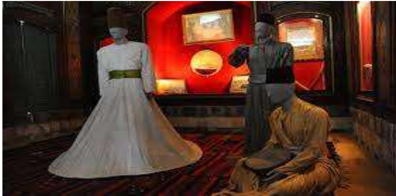
الشكل رقم (1)

وهذه المجموعات جديرة بالبحث والدراسة كونها تميز أهالي منطقة جغرافية معينة عن غيرها من المناطق اضافة الى ارتباطها بالعادات والتقاليد المتوارثة من جهة وملائمتها للعوامل الطبيعية المناخية من جهة أخرى.