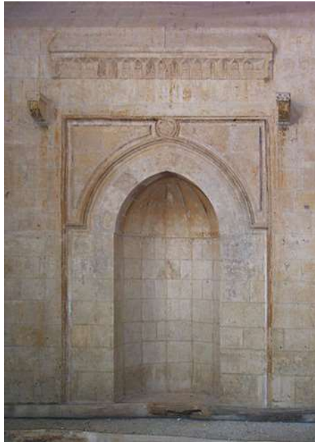
(الشكل 7): المحراب الحجري في قبليّة المدرسة (الjasر، 2019، 446)