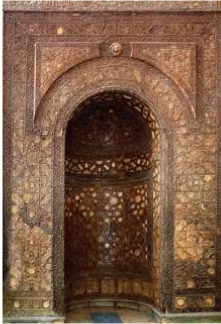
(الشكل 8): المحراب الخشبي الجميل في إيوان المدرسة (الجاسر، 2019، 446).

هي غرف صغيرة لكل منها باب ونافذة مفتوحة على الصحن، وفي كل غرفة توجد خزانة جدارية، وهذه الغرفة إما تكون مسقوفة بقبو متناول أو متقاطع.