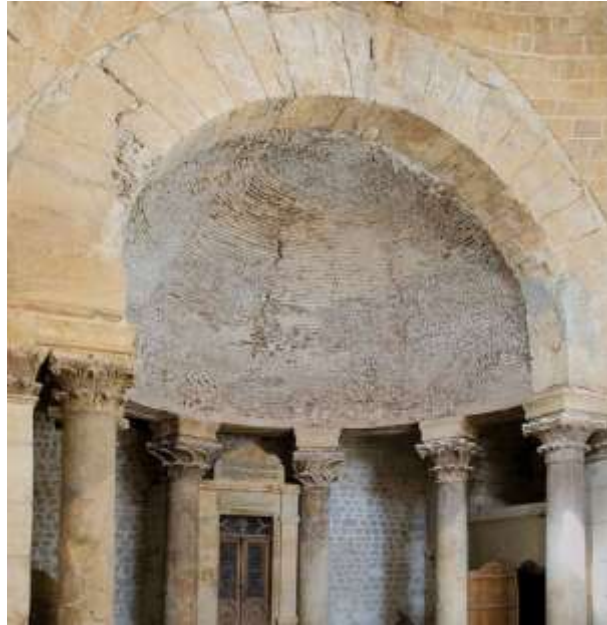
(الشكل 5): الإيوان الغربي للقبليّة (الجاسر، 2019، 446).