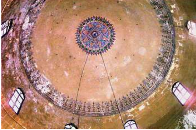
(الشكل 4): قبة القبليّة من الداخل (الجاسر، 2019، 446).