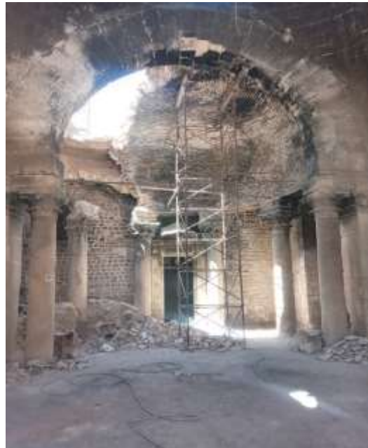
(الشكل 9): الإيوان الغربي الأكثر ضرراً في قبلية المدرسة (تصوير الباحث).

هذا البحث ممول من جامعة دمشق وفق رقم التمويل (501100020595).