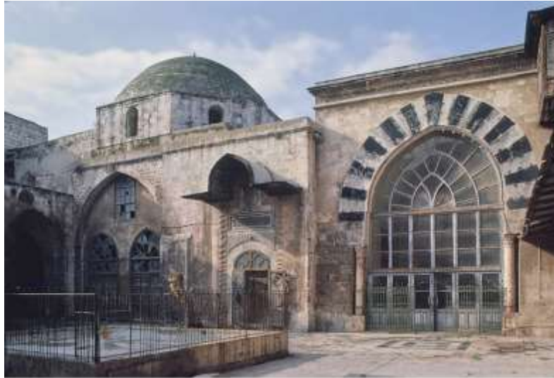
(الشكل 3): صحن المدرسة وواجهة الإيوان والقبليّة (الجاسر، 2019، 444).

منه ومفتوحة عليه بشباكين وباب، ويغطي هذا الإيوان في سقفه قبو متطاول (الجاسر، 2000، 109-113)؛ (الجاسر، 2019، 443-446).