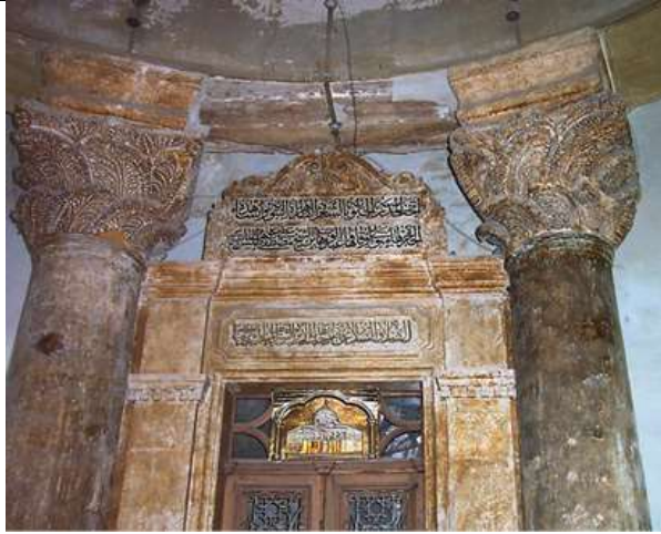
(الشكل 6): غرفة الحجر النبوية وعلى جانبيها عمودان كورنثيان (الjasر، 2019، 446).