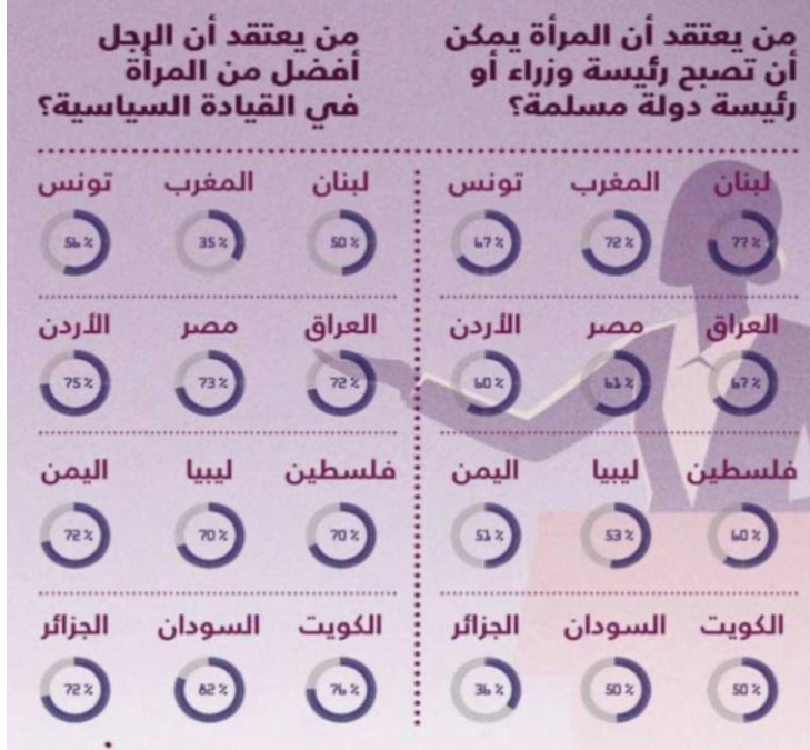
الشكل رقم ( 1 )