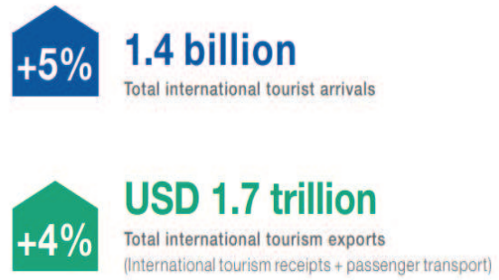
Revenues from visitor spending have grown faster than the world economy

يقوم بشراء السلع والخدمات وتناول الطعام والمبيت في الفندق، أو استئجار مكان للإقامة ، وبناء على ذلك يتوجب عليه أن ينفق المال مقابل هذه الخدمات والمنتجات، وهذا بدوره يشكل نشاط اقتصادي قوي لهذه البلدة أو الدولة ، بالإضافة إلى الدور الإيجابي الذي تحققه السياحة في الاقتصاد ، فهي أيضاً تنعكس على المجالات الأخرى ، فلها تأثير اجتماعي وثقافي ولها أيضاً تأثير سياسي وبيئي وتأثيرات أخرى سوف نتعرف عليها في الفقرات القادمة، والتي من شأنها أن تجعل هذه الدولة قوية لما لها من أهمية متميزة في محيطها لكونها محط أنظار السياح في العالم ، مُشكلة نقطة جذب سياحية تجعلها قادرة على المنافسة في هذا السوق الضخم ، وفي هذه القسم سوف نقوم بالتعرف على فوائد وأهمية السياحة بشكل مفصل ، ولكن قبل ذلك دعونا لنلقي نظرة على الشكل التالي شكل (1) والذي يبين عائدات السياحة الدولية والناتج المحلي الإجمالي العالمي للسياحة :