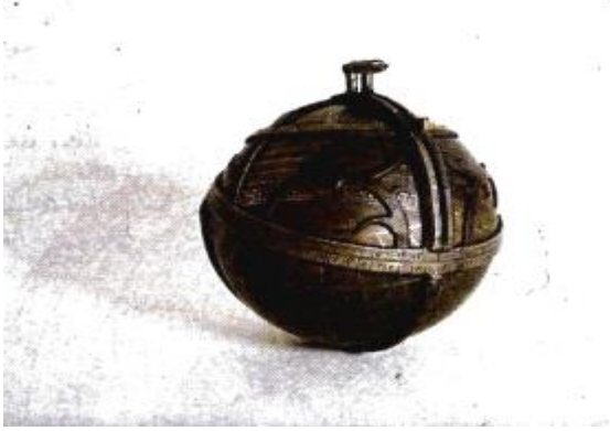
الصورة رقم (3)

الميلادي. ويشبه هذا الأسطرلاب في استعماله استعمال الأسطرلاب الكروي المسطح. صنع من نحاس مطعم بالفضة، ويبلغ قطره 83 مليمترًا، ويشير العنكبوت الذي يتحرك على الدائرة إلى مكان النجوم الثابتة (15) .