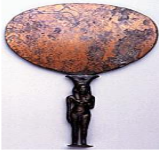
الشكل (6): مرآة من البرونز، نقلاً عن: "حواس، زاهي: سيدة العالم القديم"، ص 174.