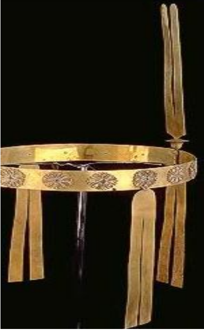
الشكل (2): إكليل ذهبي، نقلاً عن: حواس، زاهي: "سيدة العالم القديم"، ص 173.