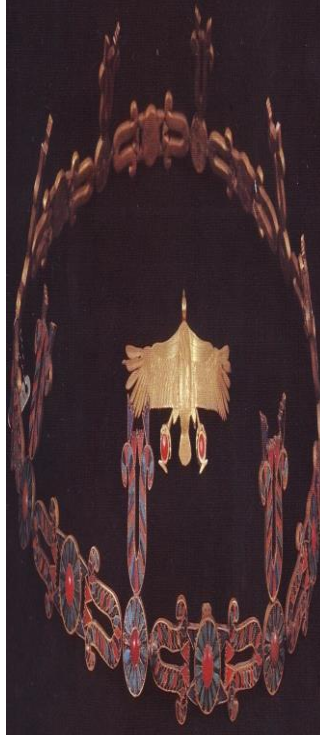
الشكل (7): تاج الأميرة خنوميت، نقلاً عن: حواس، زاهي: "سيدة العالم القديم"، ص 173.