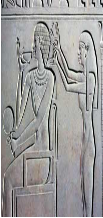
الشكل (8): يمثل عملية تصفيف الشعر، حيث نشاهد الملكة "كاويت" والمرأة في يدها، وامرأة تُصَفِّفُ لها شعرها، بينما وصيفتها تساعدها على الانتعاش بكوب من اللبن المحلوب من بقرتها التي تظهر في رسم مجاور. نقلاً عن: فياض، محمد: "المرأة المصرية القديمة"، ص 84.