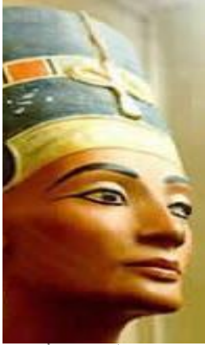
الشكل (1) تمثال للملكة نفرتيتي، نقلاً عن: يونس حسن الأغا، وسناء حسون: "المرأة في حضارتي العراق ومصر القديمة"، ص 290.