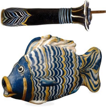
الشكل (4): مححلة زجاجية بهيئة نخلة ووعاء للزينة بهيئة سمكة، تعودان إلى عهد الأسرة الثامنة عشرة، نقلاً عن : "حواس، زاهي: المرجع السابق"، ص 174.