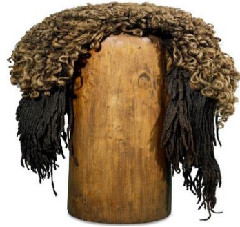
الشكل (5): شعر مستعار مصنوع من شعر بشري يعود إلى عهد الأسرة الثامنة عشرة، نقلاً عن: شورتر، آلن: "الحياة اليومية في مصر"، ترجمة: نجيب ميخائيل إبراهيم، القاهرة 1997م، ص 81.