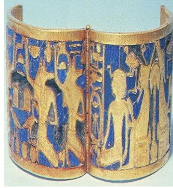
الشكل (3): نموذج لأساور، نقلاً عن : "حواس، زاهي: المرجع السابق"، ص 173.