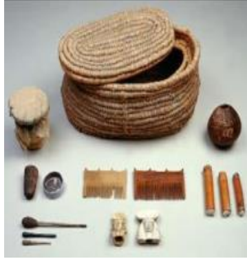
الشكل(9): الأدوات المستخدمة في التجميل، نقلًا عن: بنسلف، زينب : "الموضة والجمال"، ص52.