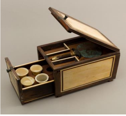
الشكل (10): صندوق أدوات التجميل، نقلًا عن بنسلف، زينب: "الموضة والجمال"، ص52.