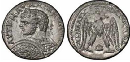
تيترادراخما من إصدار أديسا في عهد كركلا م ٢١٥-٢١٧م

أما المثال الثاني فهو من إصدار هيرابوليس (منبج شرقي حلب)، فقد حمل في مركز الوجه صورة الإمبراطور كراكلا برأسه الذي يكلمه ورق الغار، وبزي القتال ممسكاً درعاً عليه نصب الرية أتارجاتيس (عشتار) جالسةً بين أسدين، وظهر كراكلا ممسكاً سيفاً بيده اليمنى.