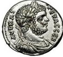
وجه قطعة نقدية من إصدار صور ووجه قطعة نقدية من إصدار صيدون

شكّلت التيترادراخما في سورية وسيلة دفع أجور الجنود في حروب الرومان ضد الفرس البارثيين، وقد مرّ تاريخياً أنّ الإمبراطور نيرون (54. 68م) أمر بإصدار تيترادراخما فضّية