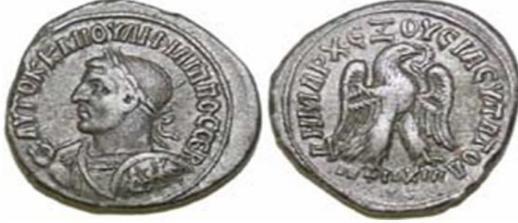
فيليب العربي والتباين في رسم النسّر

واستمر هذا الرسم أيضاً زمن بسينيوس نيجر 193م، وسبتيميوس سيفيروس (193-211م)، وغيتا 211م، وكراكلا (211-217م)، وماكرينوس، وابنه دياكومينيانوس 218م، وإيلجابالوس (218-222م)، أمّا في عهد ألكسندر سيفيروس (222-235م) فقد توقف إنتاج التيترادراخما؛ ليحلّ مكانها الديناريوس الفضي، ثم أعيد إنتاج التيترادراخما في عهد جورديانوس الثالث (238-244م)، وحصر الإنتاج في مدينة أنطاكية فقط، ويعد التباين في رسم النسّر في هذه القطع عن تلك المرسومة على نقود كراكلا قد بدأ في عهد الإمبراطور فيليب العربي (244-249م)، ولكنه بدأ بقلب مختلف وبصمات مختلفة ومن معدن البيلون (Billon) (13) .