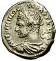
كركلا يكلل رأسه إكليل من ورق الغار متحف دمشق الوطني _ فرع الآثار الكلاسيكية الرقم المتحف ٧٥٠