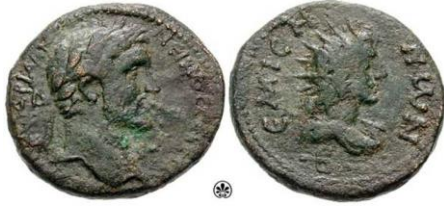
نقد برونزي من إصدار حمص في عهد أنطونينوس بيوس (التقني) ١٣٨ - ١٦١ م. حمل على الظهر نقش الإله هليوجبال