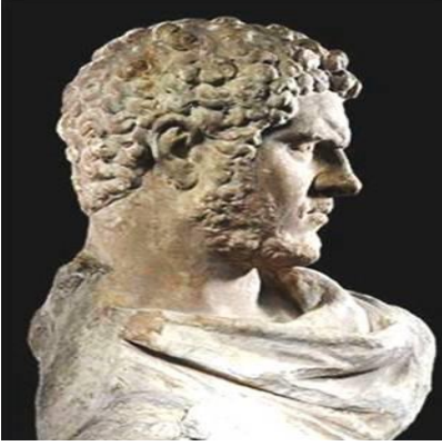
بورتريه من الرخام رأس كركلا