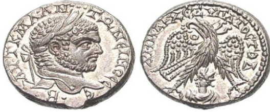
تيترادراخما من إصدار حمص في عهد كراكلا في مركز الظهر صورة نسر بين رجليه صورة إله الشمس (هليوجبالوس)

في البداية لا بدّ أن نعرّف تيترادراخما كراكلا هي -وكما هو متفق عليه من قبل علماء النميات- تيترادراخما النسر السوري (Syrian Eagle Tetradrachme)؛ لحملها في مركز الظهر صورة نسر، وهو بالحقيقة العقاب السوري. كما يمكن تسمية هذه التيترادراخما بالنقود الفضية المغفلة كونها أغفلت نقش اسم دار الضرب المنتجة لها، واقتصر الأمر على الترميز من خلال وضع رمز (Monogram)، أو صورة (Icon-Monnaies) بين أرجل النسر أو فوق رأسه أو بين جناحيه، وهذه الصورة في الغالب مستمدة من الأصول الدينية للمدينة، كمدينة حمص التي نقشت على عملتها من فئة التيترادراخما الصادرة في عهد كراكلا صورة إله الشمس (هليوجبالوس) بين رجلي النسر، أو مدينة تريبوليس (طرابلس) التي وضعت على نقودها بين أرجل النسر صورة بيضتين فوقهما نجمتان ترمزان إلى المحاربين كاستور وبولكس، أو ما يعرف باسم (ديوسكوروس) (5) .