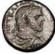
وجه قطعة نقدية من إصدار فرغوس ووجه قطعة نقدية من إصدار فطحية