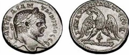
تيترادراخما كراكلا بين رجلي حيوان الموريكس النسر وفوق هراوة ملقارت الرياضية

الرياضية (AKTIA-HPAKEA-OLYMPIA) وفي أسفل الجرة نقشت صورة حيوان الموريكس الصدفي الذي كان يستخرج منه الصباغ الأحمر، بينما نراه على تيترادراخما كراكلا بين رجلي النسور وفوق هراوة الإله ملقارت (إله عُبُد في صور الفينيقية ويعني سيد القرية).