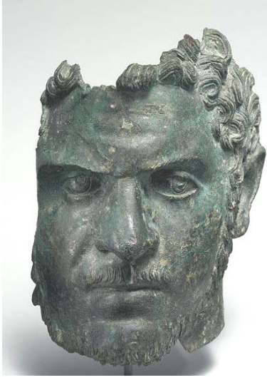
رأس الإمبراطور كركلا

وكان عمر كراكلا خمس سنوات عندما أصبح والده إمبراطوراً عام (193م)، وقد حكم بين عامي (211 . 217م)، أما أخوه غيتا (Geta) فاسمه الحقيقي "بوبيليوس سبتيميوس غيتا" ولُقّب على المسكوكات بالكتابة اليونانية (ΓΙΤΑC)، وانتهت حياته بعد موت والده حين قتله أخوه كراكلا عام (211م)، وبذلك أقصاه عن العرش والحياة؛ ليصبح كراكلا الوريث الوحيد لأبيه. نُقش اسم كراكلا على المسكوكات الفضية من فئة التيترادراخما "ماركوس أوريليوس أنطونينوس" (M{ARCUS} A{URELIUS} ANTWNINOC).