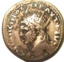
كركلا يعلو رأسه تاج شعاعي متحف دمشق الوطني _ فرع الآثار الكلاسيكية الرقم المتحف ٧٦٣٢/٩

وتوجد قطع نقدية له من فئة التيترادراخما حملت على الوجهين (الوجه والظهر) رأس الإمبراطور كراكلا، فعلى الوجه الأول نلاحظ رأس كراكلا يعلوه التاج الشعاعي، بينما حمل الوجه الثاني رأس الإمبراطور كراكلا المتنوّج بتاج شعاعي مرفوعاً بجناحي النسر،