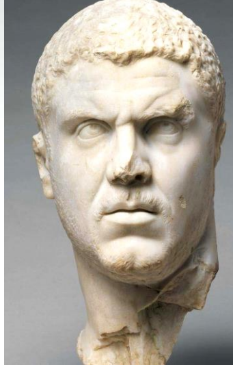
رأس الإمبراطور كركلا