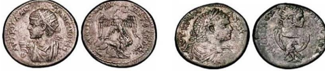
هيرابوليس (منبج شرق مدينة حلب)