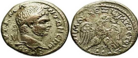
تيترادراخما من إصدار تريبوليس (طرابلس) في عهد كركلا في مركز الظهر صورة نسر بين رجليه صورة بيضتين ترمزان إلى كاستر وبولكس أو ما يعرف باسم (ديوسكورس).

أما مركز الوجه فقد حمل صورة الإمبراطور كراكلا بزيه الإمبراطوري، وعلى رأسه إكليل الغار، كما جسّد على تيترادراخما أخرى برأسه المزدان بالتاج الشعاعي الذي يرمز إلى عقيدة الشمس التي يمثلها بشخصه.