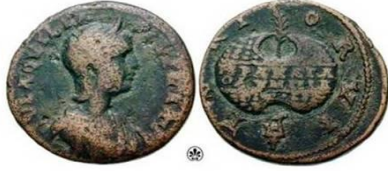
نقد برونزي حمل في مركز الظهر صورة جرة الألعاب وفي أسفلها نقش صورة حيوان الموريكس الصدفي

ومن الأمثلة أيضاً نقد برونزي من إصدار حمص في عهد أنطونينوس بيوس (النقي) (138 . 161م)، حمل في مركز الظهر صورة رأس إله الشمس "هليوجبال" متوجاً بتاج شعاعي، وكتب حوله اسم دار الضرب (حمص EMICHNWN)، في حين انتقلت صورة هذا الإله إلى تيترادراخما كراكلا الصادرة في حمص لتكون بين رجلي النسور، ومن هنا أمكن نسبة هذه التيترادراخما إلى دار ضرب حمص بسبب إلهها المشهور الذي انتقلت عبادته إلى روما في عهد الإمبراطور إيلجابالوس (فاريوس أفيتوس باسيانوس) (218 . 222م).