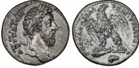
ماركوس أوريلوس والتحوّل في رسم النسّر

واستمر هذا الرسم أيضاً زمن بسينيوس نيجر 193م، وسبتيميوس سيفيروس (193-211م)، وغيتا 211م، وكراكلا (211-217م)، وماكرينوس، وابنه دياكومينيانوس 218م، وإيلجابالوس (218-222م)، أمّا في عهد ألكسندر سيفيروس (222-235م) فقد توقف إنتاج التيترادراخما؛ ليحلّ مكانها الديناريوس الفضي، ثم أعيد إنتاج التيترادراخما في عهد جورديانوس الثالث (238-244م)، وحصر الإنتاج في مدينة أنطاكية فقط، ويعد التباين في رسم النسّر في هذه القطع عن تلك المرسومة على نقود كراكلا قد بدأ في عهد الإمبراطور فيليب العربي (244-249م)، ولكنه بدأ بقلب مختلف وبصمات مختلفة ومن معدن البيلون (Billon) (13) .