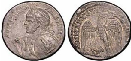
تيترادراخما من إصدار هيرابوليس (منبج) في عهد كركلا ٢١٥-٢١٧م