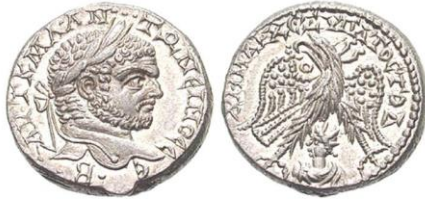
تيترادراخما فضية صادرة في حمص في عهد كراكلا ٢١١-٢١٨ م. في الظهر نسر وبين رجليه صورة إله الشمس (هليوجبال)

ونلاحظ كثيراً من الأمثلة؛ لهذا ارتأينا أن نلحق الجدول الآتي الذي يبين الرموز المرافقة للتيترادراخما الصادرة في عهد الإمبراطور كراكلا موضحةً بالرسم والتصوير والشرح الموجز.