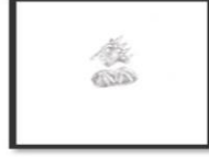
إيميسيا (حمص) 28