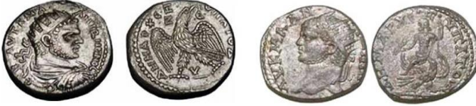
زوغا (في كيليكية)