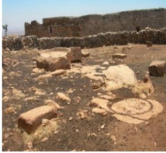
(الشكل 4): بقايا منشأة معصرة زيتون، قرية الكورة.

1. بقايا معصرة زيتون في قرية راشا القبلية 1 تقع شمال شرق الكنيسة الأثرية 2 ، حالة حفظ المعصرة متوسطة محاطة بسور مبني من قبل الأهالي المحليين ما يزال فيها حجر العصر ومكان وضع المكبس وحوض ترسيب (الشكل 4).