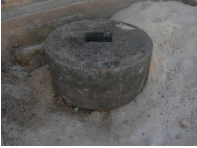
الشكل (11): العجلة المتحركة meule من البازلت

• حجر التثبيت (Pierres d'ancrage): وهو عبارة عن حجر من الكلس أسطواني الشكل يستخدم لتثبيت الرافعة بطريقة اللولب في المعاصر، يوجد على السطح العلوي للحجر حفرة دائرية في الوسط وعلى الجانبين تجويفين جانبيين وذلك لتثبيت المحور بعوارض خشبية الذي سوف يثبت مع السقف (الشكل 13). تم العثور على سبعة أحجار من هذا النموذج اثنان في قرية الصباغية والصحيرية وواحد في كل موقع حورته، المشيرفة، راشا القبلية، وأم نير الشمالية. لم يكن الحجر الكلسي فقط المستخدم، وإنما يوجد أحجار تثبيت من البازلت وجدت في كل من موقع بشلة ومعر زيتة.