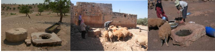
الشكل (3): خزانات مياه موقع المعمودية، قرية فليفل، موقع بطمة

إذا يمكننا القول إن النظام المائي وطرق التزود بها سواء كانت آبار طبيعية أو محفورة أو خزانات ضخمة هي جدا متماثلة ومشابهة لما تم توثيقه في الجزء الشمالي من جبل الزاوية وجبل باريشا. ولابد من الإشارة إلى أنه في كثير من المواقع تم توثيق المعاصر أو بعض عناصرها المعمارية مع تواجد كثيف للآبار أو الخزانات كما الحال في موقع المعمودية وراشا القبليّة. إذاً فيما يخص التضاريس التي وصفناها بأنها غير متوافقة مع الجزء الشمالي من جبل الزاوية حيث تكثُر الارتفاعات إلا أنها عرفت