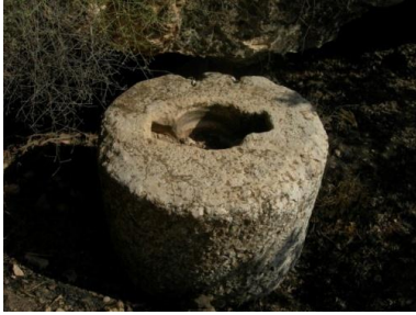
الشكل (12): حوض الترسيب، قرية عابدين

• حجر التثبيت (Pierres d'ancrage): وهو عبارة عن حجر من الكلس أسطواني الشكل يستخدم لتثبيت الرافعة بطريقة اللولب في المعاصر، يوجد على السطح العلوي للحجر حفرة دائرية في الوسط وعلى الجانبين تجويفين جانبيين وذلك لتثبيت المحور بعوارض خشبية الذي سوف يثبت مع السقف (الشكل 13). تم العثور على سبعة أحجار من هذا النموذج اثنان في قرية الصباغية والصحيرية وواحد في كل موقع حورته، المشيرفة، راشا القبلية، وأم نير الشمالية. لم يكن الحجر الكلسي فقط المستخدم، وإنما يوجد أحجار تثبيت من البازلت وجدت في كل من موقع بشلة ومعر زيتة.