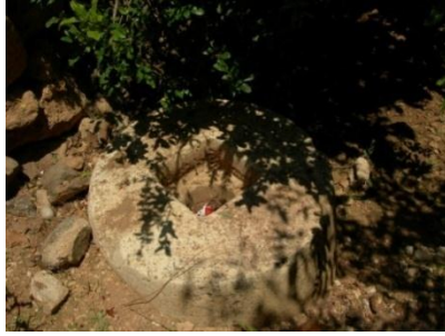
الشكل(10): العجلة المتحركة meule من الكلس

Broyeurs mixtes عبارة عن أحواض دائرية ذات سطوح مسطحة أو مقعرة قليلاً لا تحتوي على انتفاخ في مركزها . أربعة أحواض فقط من هذا النموذج تم توثيقها في كل من راشا القبلية ومعر سخاطة والمشيرفة وهورتة (الشكل 8).