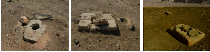
الشكل (2): آبار محفورة ومسدودة بحجارة غير مستخدمة قرية دير سنبل وموقع رسم بعربو.

لتجميع المياه، وفي موقع المعمودية وبطمة لحظنا هذا النموذج نفسه من الخزانات، جميعها ماتزال مستخدمة من قبل الأهالي لسقاية المواشي (الشكل 3).