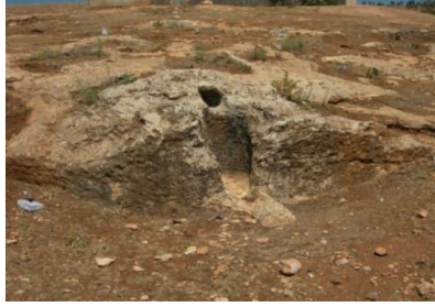
الشكل (15): أحواض هرس العنب، قرية الملاحة.

فيما يخص أحواض هرس العنب تم العثور وتوثيق الكثير من هذه الأحواض في الجزء الشمالي من الكتلة الكلسية ، وخصوصاً في داحس في جبل باريشا وفي قالوطة وخراب شمس وكوكبا، وحسب رأي بيسكوب وجان بيير برون 1 بأن هذه المنطقة مارست زراعه الكرمة في قلب المناطق على خلاف الزيتون في مساحات واسعة وأن هذه الأحواض تعدُّ بدائية في عملها.