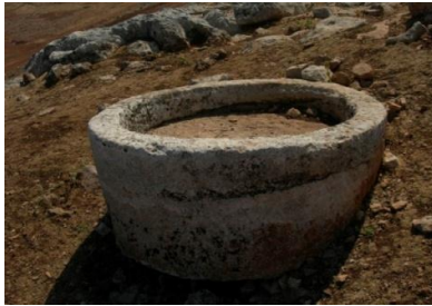
الشكل(9): موقع المعمودية. ،Broyeurs، موقع المشيرفة

الجزء الثاني وهو ما يعرف باسم (meule) أي العجلة المتحركة وهو عبارة عن حجر كلسي أو بازلتني، دائري الشكل بأقطار مختلفة وسماكات مختلفة محفور في وسطه على الجانبين فجوة مربعة الشكل بأبعاد حوالي 30 سم وعمق 5-6 سم ويخترقها ثقب آخر دائري ليتركب بداخله ذراع خشبي بطول حوالي 20 م من أحد الجانبين ويثبت من الجانب الآخر مع حجر الطاحون الكبير (الشكل 10 و11). وهذا النموذج من أحجار الطحن ذكرها CALLOT وأغلبها كان في الهواء الطلق وليس بالضرورة أن يكون