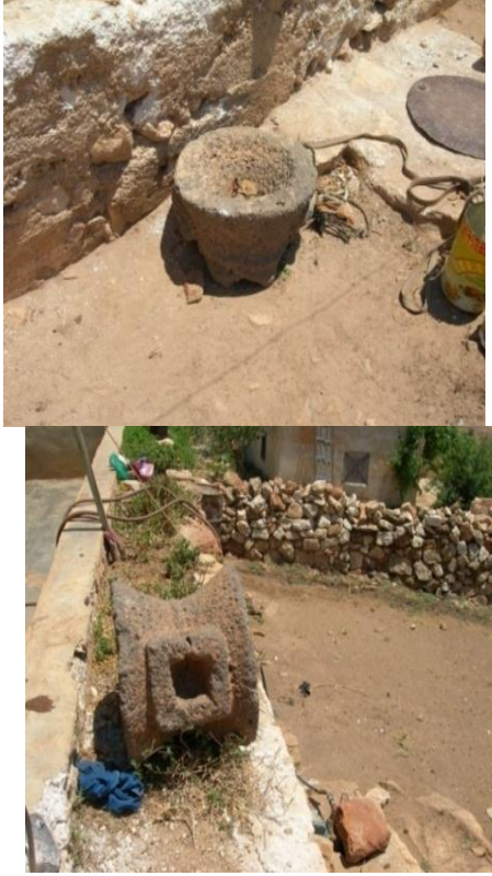
الشكل(16): حجران بازلتيان يستخدمان في طحن الحبوب، قرية أم نير القبيلية. أما النموذج الثاني عبارة عن عجلتين دائرتي الشكل، السطح الأفقي لكلا القرصين محزوز بشكل أفقي لتسهيل عملية طحن الحبوب، في وسط القرص يوجد ثقب يخترق