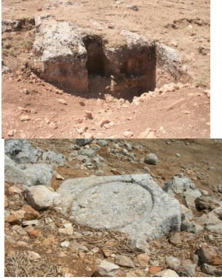
الشكل (6،7): حجر mais وحوض ترسيب، موقع أم نير الشمالية.

لإعادة استخدام بعض الأحجار 1 التي تعود أغلب الظن للمعصرة نفسها في سور حديث حول منزل أحد الأهالي. 5. حوض محفور بالصخر في موقع أم نير الشمالية الأثري 2 مع حفرة مشابهة لما وجد في قرية الملاحة، مع وجود بقايا أخرى كحجر التثبيت والحجر الذي يتم وضع أفراس الزيتون (mais) عليه لكبسها وهذا دليل قاطع على وجود معصرة زيتون (الشكل 6-7).