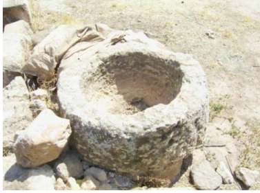
الشكل (13): حجر تنبيت، موقع الصباغية.

الغالبية العظمى من أحجار التنبيت في الجزء الشمالي من الكتلة الكلسية هو أسطواناني الشكل مع اختلاف بالأقطار والأوزان. ميز CALLOT عدة نماذج من هذه الأحجار 1 ومعظم ما تم توثيقه في الجزء الجنوبي من جبل الزاوية يعود للنموذج C2 وهو مشابه للمعصرة رقم 1 أو 3 في المنزل رقم 9 في قرية سرجيلا 2 . إذا وجود هذا النوع من أحجار التنبيت على الرغم من قلته في الجزء الجنوبي من جبل الزاوية يدل على وجود معاصر ذات اللولب. هذا النموذج من أحجار التنبيت موجود في أغلب دول البحر المتوسط ولكن مع اختلاف بسيط في المحور المركزي كموقع قفصة وعين الجديد في فلسطين 3 .