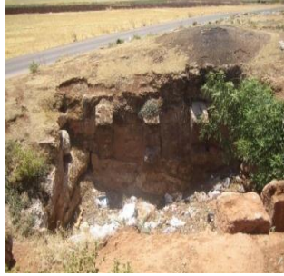
(الشكل 5): أساسات معصرة زيتون موقع راشا القبلية.