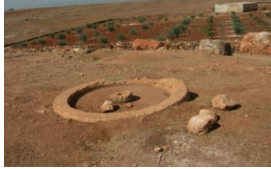
الشكل (8): Broyeurs mixtes