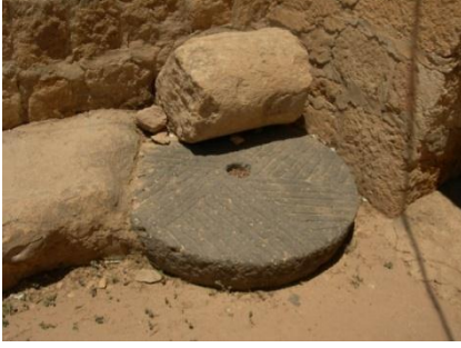
الشكل (17): حجر طحن حبوب من البازلت، قرية معرة تمار. .

الوجهين العلوي والسفلي ليسمح بمرور المحور الرأسي الذي يتسبب في الحركة الدورانية للعجلة العلوية (الشكل 17).