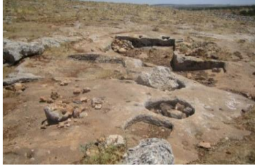
الشكل (14): أحواض هرس العنب، موقع معر جلق.