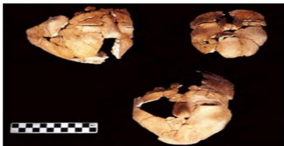
شكل رقم 17، يبين الأفتنة الثلاث التي تم اكتشافها في موقع عين غزال: Schmandt-Besserat 2013, 222

امتازت هذه الأفتنة بأنها اتخذت شكل الجمجمة وبحجمها الطبيعي تقريباً وإن اختلفت قياسات هذه الأفتنة، ويعود ذلك إلى أن طريقة صنع هذه الأفتنة كانت تتم بواسطة استعمال الجماجم البشرية مباشرة كقوالب، ثم تنزع بعد أن تجف تماماً، ومن خلال دراسة أحجام هذه الأفتنة وقياساتها وأشكالها تبين أنها تعود لرجل وامرأة وطفل. كانت العيون مغلقة الأجفان في جميع الأفتنة (الشكل 17)، وهناك معالجات تشريحية واضحة لبروز عظام الوجنتين والجمجمة والحاجبين، إلا أن افتقاد الجماجم الأصلية لعظم الفك السفلي، أثر بشكل واضح في هيئة الشكل الخارجي للأفتنة 27 .