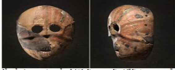
شكل رقم 18: بين القناع الحجري المكتشف في وادي حمار في فلسطين عن: Yakar R., Hershkowitz J. 1988

الفم بطريقة الشق والنحت (الشكل 18)، أربعة في كل فك، تظهر أعلى الشفاه بقع من القار 28 ، لذلك على تلوين أحمر وأخضر وخطوط شعاعية تمتد من المركز باتجاه المحيط وكأنها تمثل لحية.