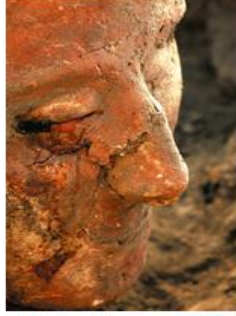
شكل 16: يبين الدقة في تحت الأنف على أحد جماجم تل أسود