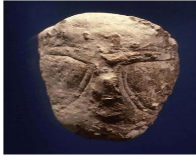
شكل رقم 4 يبين نحت للرأس من موقع عين الملاحه عن: Grosman, L., D. Shaham, F 2017