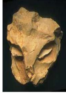
شُكُل رَقْم (2) يظهر محاولة لتَشكيل ملامح للوجه من كهف لاروش كوتارد (La Roche cotard cave)

وجاءت محاولة الإنسان العاقل في كهف (تروا فريير TroisFreres) في فرنسا المؤرخ ب 14000 الف سنة قبل الميلاد برسم قناع يشابه ما يرتديه الشامان أثناء الطقوس الخاصة في الصيد (الشكل 2 أ- ب).