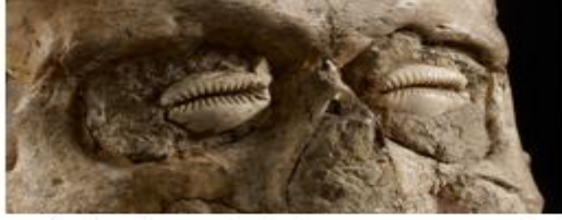
شكل 11: يبين إعادة تشكيل العين بالصدف أريحا

كما تم تشكيل العين لجماجم أريحا عن طريق وضع طبقتين من الأصداف، مع وجود شق نصفين بين الصدفتين، وهذا الشق يوحي بعين تشبه عين حيوان مثل القط، أكثر مما تشبه عيناً بشرية 16 ، وربما لم يكن القصد منها تشكيل عين حقيقية، بل مجرد إشارة رمزية للعين (الشكل 11).