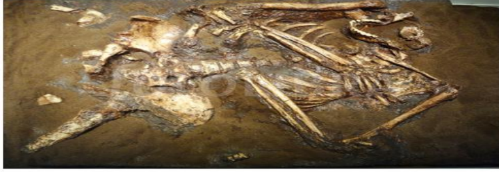
شكل رقم 1: يبين هيكل نياندرتال بدون الجمجمة المكتشفة في مغارة كبارا عن: Tillier 2003.

اهتم الإنسان بمختلف أجزاء جسده وحاول الحفاظ عليها وقد أعطى أهمية خاصة للرأس. حيث يعدُّ كلُّ من الرأس والوجه المحددان الرئيسان للأشخاص، فيمكن تمييز الأفراد من اختلاف ملامح الوجه وشكل الرأس بالدرجة الأولى، كما أن الرأس يعدُّ مقراً للروح، والرأس يمتلك قوة الحياة فهو رمزٌ عميقٌ للقوة يرتبط ارتباطاً وثيقاً بمفهوم الحياة، والموت، والخصوبة. وهذا المفهوم للرأس ظهر بشكل واضح في الطقوس الجنائزية منذ العصر الحجري القديم الأوسط لدى إنسان النياندرتال الذي كان أول من مارس طقوس جنائزية واضحة ومنها الاهتمام بالرأس، ففي فرنسا عُثِر على مدفن يعود لإنسان النياندرتال تضمن هيكلاً عظمياً لطفل تشي جسده وفُصِّل رأسه ودفن في قبر مستقل، ومن فلسطين عُثِر في مغارة الكبارا (Kebara Cave) على بقايا هيكل لإنسان نياندرتال منزوع الجمجمة ومن المرجح أن الجمجمة نزعت بشكل متعمد 1 (الشكل 1)، بعد موت الرجل بشهور، وتشهد هذه الممارسات الجنائزية على الأهمية التي حظي بها الرأس عند إنسان النياندرتال والتي كانت باكورة عبادة الإنسان للرأس.