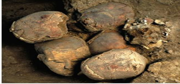
الشكل رقم 15: المجموعة الثانية من الجماجم المخصصة المكتشفة في تل أسود عن: Stordeur D. and Khawam R. 2007

وهناك خط أفقي في وسط العين يفترض النقاء الجفون. وخط من اللون الأسود (ربما مادة القار) وضع كإشارة على رموش العيون، والأنف طويل ونحيل وبارز بشكل واضح مع افتراض وجود الفتحات الأنفية، أما الجماجم المقولبة فكانت واقعية الشكل، والوجه مرهف و الملامح جميلة جداً. الجمجمة كانت في الوسط تقريباً ملاصقة للجمجمة أخرى ويشكل الوجهان نوعاً من الانسجام فيما بينهما 26 ، وكل ذلك يدفعنا إلى الاعتقاد بأنهم وضعوهما معاً عن قصد ولهدف ما. تم التلوين في الوسط بالمغرة الصفراء الزاهية. إن المهارة والمعرفة كانت واضحة بصفة خاصة من خلال الأنف (الشكل 16) مع وجود قاعدة مجهزة بشكل جيد تظهر أن فتحتي الأنف كانتا مفصولتين بخط طولي. وإن واقعية المعالم وجماليتها كانتا تدلان على ذوق فني عند سكان تل أسود.