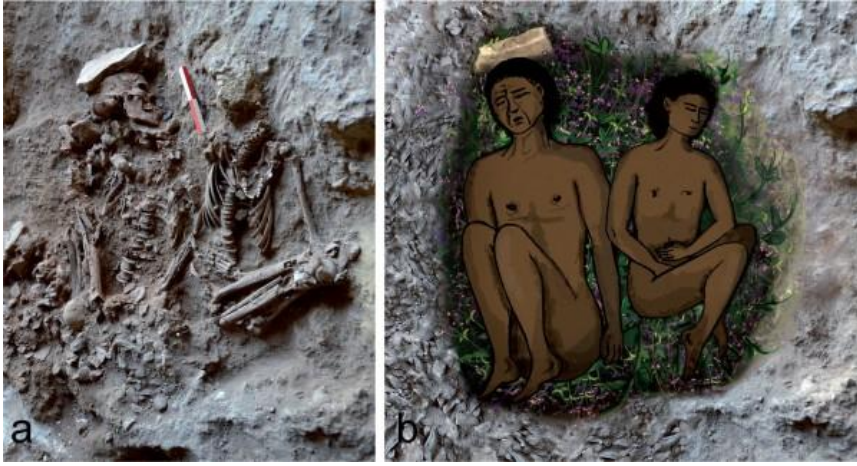
الشكل (3): يبين الهيكلان من موقع رقتا كما هما لحظة الاكتشاف، مع صورة توضيحية لوضعية الدفن عن :

وفي كهف (رقتا) في فلسطين الذي ضم بقايا عظمية ل 29 فرداً، تم دفن اثنين منها على الظهر وبوضعية القرفصاء 3 هيكل رقم (25 يعود لشخص بالغ) وضع أعلى الرأس بلاطة حجرية بما يشبه الوسادة، بينما الهيكل الثاني هيكل رقم (28 يعود لمراهق)، وقد تمت إزالة جمجمة هيكل رقم 28 بعد فترة طويلة من عملية الدفن بشكل طقسي حيث ضمَّ المدفن بقايا نباتية لأزهار معينة (الشكل 3).