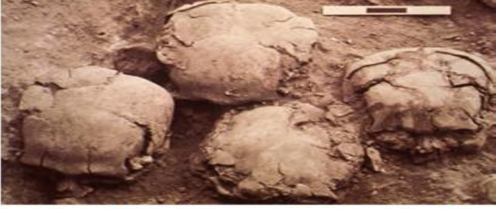
شكل 13: يبين جماجم عين غزال كما عثر عليها في الموقع عن:

كما جاءت ثاني أكبر مجموعة من الجماجم المجصصة من موقع تل الرماد، حيث تم الكشف عن ثلاثة وعشرين من الجماجم المجصصة وضعت في ثلاث مجموعات، حيث ضمت المجموعة الأولى خمس جماجم لإناث، واثنيتين لذكور، وفتى بلغ عمره ثلاثة عشر عاماً 22 . احتفظت هذه الجماجم بالفك السفلي، ووضعت عليها طبقة من الجص، مع طلاء الوجه باللون الأبيض، وقد حملت الجبهة وأعلى الرأس بقعاً حمراء، وصنع بؤبؤ العين من الجص الرمادي وحدقة العين باللون الأبيض 23 . وقد تضمنت المجموعة الثانية جماجم لاثنين