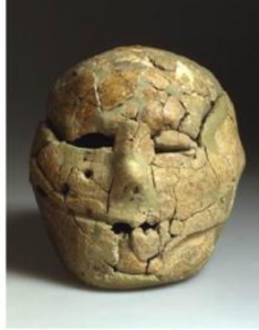
شكل رقم 12: يبين الجمجمة المخصصة من موقع بيسان في فلسطين

الوجه، فقد مُثل بؤبؤ العين بقطع صغيرة من الجص، كما تم نزع الأسنان قبل الدفن، مع الاحتفاظ بالفك السفلي والجمجمة المفتوح قليلاً، والأسنان فيه عبارة عن صفوف قصيرة ومتوازية ومتقاطعة من الجص (الشكل 12)، وأعيد تشكيل الأنف، فظهر بشكل دقيق، وقصير، ووضع مكان الفتحات الأنفية ثقبان دائرياً الشكل 18 .