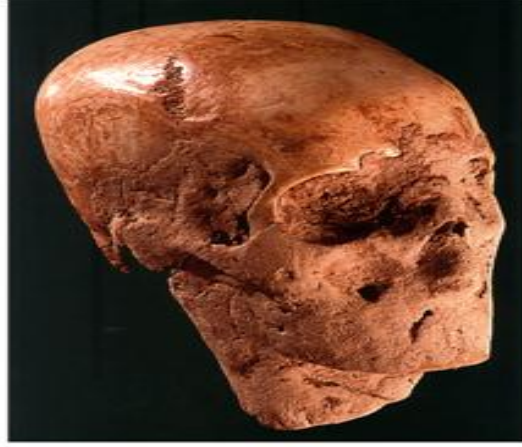
شكل رقم 14 : جمجمة مجصصة من تل الرماد عن: Schmandt-Besserat 2013

من الإناث وذكر واحد، تم وضعها مقابلة لأساس حجري ومختلطة ببعض الدمى البشرية، وتم تجسيص هذه الجماجم بطلائها باللون الأحمر (الشكل 14).