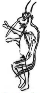
شُكُل رَقْم 2-أ تمثِّل قَنَاع حيواني على وجه بشري من تِل (ترافير). شُكُل رَقْم 2-ب رسم تخيلي لشُكُل الشامان.