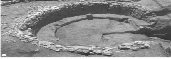
شكل 7: رقم يبين البيت الطقسي من جرف الأحمر