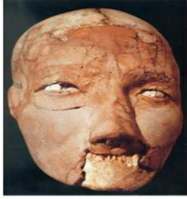
شكل رقم 10-ج: يبين الفك السفلي في أحد جماجم أريحا المجصصة عن: Bonogofsky M, 2003

مرحلتين، المرحلة الأولى تمّ ملء جميع الفجوات والندوب (محاجر العين، فراغات الأنف، تجويف الفم) بالجص الخشن الممزوج بالمغرة الحمراء. أما المرحلة الثانية فكانت بعد اكتمال المرحلة الأولى، تم وضع طبقة من الجص الناعم البني (وأحياناً بني محمر) على الوجه فقط، باستثناء إحدى الجماجم التي وضعت عليها مجموعة من الخطوط السوداء في محاولة لتشكيل الشعر 14 (الشكل 10 - أ). أما أسفل الجمجمة فقد ملئ بالجص مشكلاً قاعدة أخذت الشكل المقعر، مما يدعو إلى الافتراض أن الجماجم كانت توضع للعرض على منصة أو رفّ، والقاعدة المقعرة ستضمن وضعاً أفضل للجمجمة (الشكل 10-ب).