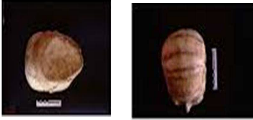
الشكل (10- أ- ب): يبين الخطوط التي تم تشكيلها جماجم أريحا، والتقعر الذي تم تشكيله أسفل الجمجمة عن: Strouhal

أنه أعيد تشكيل الفك السفلي بالجص، باستثناء إحدى الجماجم فقد احتفظت بالفك السفلي (الشكل 10-ج)، أما بالنسبة للأنف فقد وضع بشكل جيد، ويعود ذلك إلى التحديد التشريحي السهل لبروز الأنف، كما جاء التعبير عن الفم مرتين على شكل شق مستعرض قصير، وجاء تشكيل صيوان الأذن على شكل نتوء صغير وبسيط، وفي حالات أخرى شكلت الأذن كنتوء بيضاوي أكبر وغير عادي 15 .