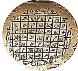
(الشكل 4) (الطاسة رقم 3) (عن البوني: شمس المعارف الكبرى، ج1، ص94)

ويصفه البوني في كتاب شمس المعارف الكبرى: " ومن جملتها أن تكتب هذه الإشارات ما يُغني عن الكلام، ولو علمت ما بها من غرائب وعجائب لأن هذا سر الله المكنون واسمه العظيم والأعظم فأتق الله والله يقول الحق ويهدي السبيل"، وذكر الدعاء المبارك: " اللهم إني أسألك بالهاء من اسمك الأعظم وبالثلث والعصى والألف المقوم والميم الطميس وبالسلّم وبالأربعة التي هي كالكف بلا معصم وبالهاء المشقوقة والواو المعظم صورة اسمك الشرف الأعظم" 24 .