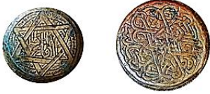
(الشكل 9-ب) (الطاسة 6)

جوهر الأثنياء 39 ، واطلق عليها اسم (خاتم سليمان) واعتقد أن لها تأثير سحري في درء الخطر و نيل الحماية 40 ، نُقشت أشكال النجوم على بعض الطاسات حيث ظهرت النجمة الخماسية والسداسية الرؤوس كما في التحفة رقم (2) (الشكل 9-أ) ونُقشت النجمة سداسية الرؤوس من تداخل أحرف اللام في الآية (84) من سورة الإسراء: كُلُّ كُفٍّ يَعْمَلُ عَلَى شَاكِلَتِهِ ، وعلى مركز الصرّة من الخارج مُشكلة من مثلثان متداخلان ببعضهما على الطاسة رقم (6) (الشكل 9-ب).