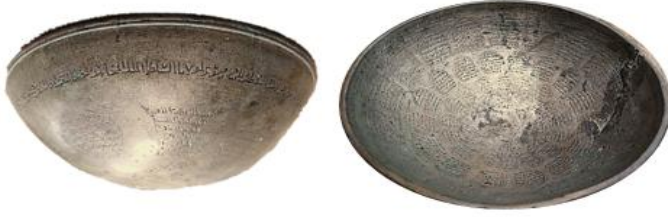
الطاسة الأولى: (تصوير الطالبة)