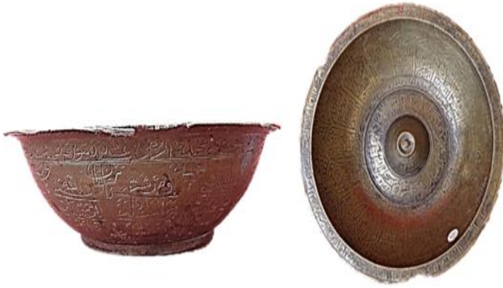
الطاسة الخامسة: