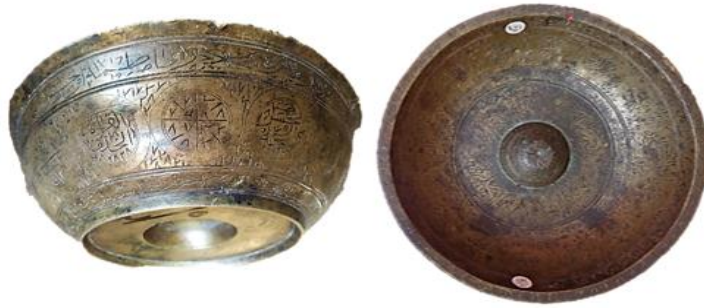
الطاسة الرابعة: