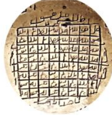
(الشكل 6) (الطاسة رقم 3) (عن ابن عربي: الكبريت الأحمر، ص 159)

دُكر أن آية الإخلاص مكانة كبيرة لدى المسلمين لما لها فائدة في الوقاية من الشر والحسد، فهذا الوقف جزر مبارك وإن كُتب في بيت يكون خيراً ومباركاً 28 ، ويذكر البوني فوائد هذا المربع، " وهذا الاسم الصمدائي والسر الروحاني، من أكثر من ذكره وجد فيه سر لطيف لمن أراد إزالة العقم عن الرجل والمرأة فليكثر من ذكره، فيحل له ذلك، كما أنه يعد سبباً في الظفر بالحروب، ويكتب على ورقة يرزقه الله الهيبة والعز والوقار والهداية". وهذا الاسم من أقرب الأسماء إلى الذات ومن أعظم الأذكار وأجلها، واعلم أن ذكر اسم الواحد الأحد ذكرٌ جليل عظيم الشأن" 29