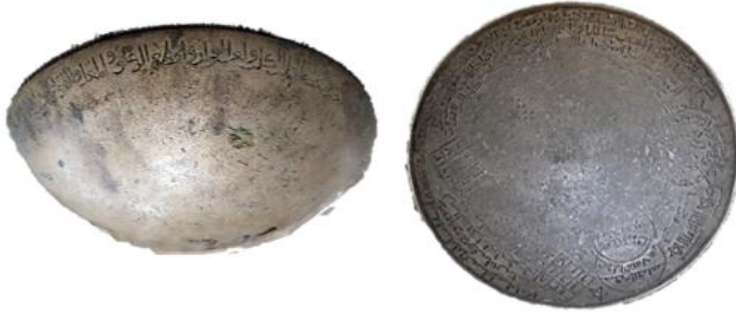
الطاسة الثانية: