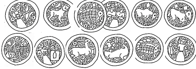
(الشكل 8) (الأبراج الاثني عشر على الطاسة 3) (عمل الطالبة)

قول للرسول يتحدّث فيه: "أن الأئمة يكونون من بعدي اثنا عشر الأول هو علي بن أبي طالب والثاني عشر هو القائم المهدي وهو الهادي الذي يأخذ الله بيده ليعمل على فتح مشارق الأرض ومغاربها"، ويقول الرسول مخاطباً علي: " الأئمة الهادون المهديون الأطهار سيكونون يا علياً اثني عشر (أي إحدى عشر إماماً وأنت) من ذريتك أنت أولهم وآخرهم يكون على اسمي، وعندما يظهر يملأ الأرض عدالة وألفة" 36 .