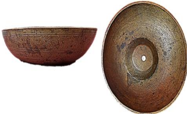
الطاسة السادسة: