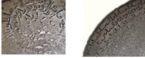
(الشكل 7) (كتابات طلسمية على الطاسة رقم 2)

ونصها: "سارا سارا را في سارا عاتي نور نور نور أنا وأرميا فاه يا طورا كاطوا برملس أوزانا أو صنانيما كما يوقا بانيا ساتيا كاطوط اصبأوتا ابريلس توتي تنا أوس"، وهذه الكتابة تكتب على ورقة أو على طاسة نظيفة أو قصعة ويكتب اسم أب وأم الشخص الموعوك فيشرب من ماء الطاسة فيشفى، كما يسقى منها الشخص الملسوع بلسعة أفعى 30 أو عقرب 31 . (الشكل 7).