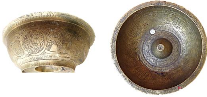
الطاسة الثالثة: