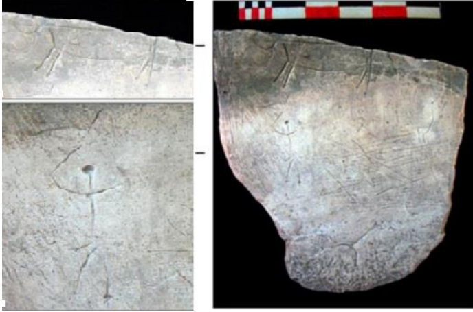
الشكل 1: مشهد صيد من تل العبر 3 منحوت على بلاطة حجرية.