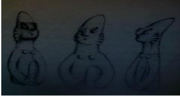
الشكل 120: دمية جبيل. (كوفان، جاك 1988، ص 104).

النيوليت على المراحل الثلاثة لجبيل إلا أن المرحلة الأقدم (النيوليت القديم) هي فقط التي تعود للعصر الحجري الحديث الفخاري، أما المرحتين اللاحقتين فتعودان للعصر الحجري النحاسي 28 . عثر في هذا الموقع على دمية مصنوعة من الطين المشوي، تؤرخ على العصر الحجري الحديث الفخاري (النيوليت القديم في جبيل)، وهي بوضعية الوقوف، يبلغ ارتفاعها 8سم، رأسها مخروطي ومائل إلى الخلف، والوجه على شكل مثلث وتصله عن الرقبة ذقن واضحة، وأشير إلى الفم بنقطة، وأشير إلى الأذنان بكرات متطاولة، أما الأنف فهو معقوف ومشار إليه بقطعة من الطين، والعينان على شكل حبات القمح، وبقية الجسم يقتصر على صدر أشير إليه بكرتين، والذراعان يميلان للأسفل والأمام، وأضيف في المنطقة الفاصلة بينهما عضو ذكري بطول 20 سم (الشكل: 7)، وبالتالي فإن هذه الدمية جمعة صفات الجنسين 29 .