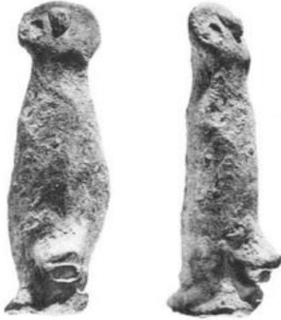
الشكل 6: دمية منحطة. (PERROT J. 1966, P. 56.)

5- دمية منحطة : يقع موقع منحطة في وادي الأردن, على مسافة 15 كم إلى الجنوب من بحيرة طبريا, وقد تم تنقيبه من قبل ج بيروت ابتداء من عام 1962م, 24 وعثر فيه على قرية تؤرخ على العصر الحجري الحديث ما قبل الفخار B, وهي غنية بمكتشفاتها الأثري, التي كان من أبرزها فيما يخص موضوع بحثنا دمية ذكرية تعود للعصر الحجري الحديث ما قبل الفخار B الأوسط, 25 وهي مصنوعة من الطين المشوي, بوضعية الوقوف, يبلغ ارتفاعها 5 سم, أشير للوجه والرأس بشكل شبه مستطيل, وأشير للعينان والأنف بإضافة كرات طينية, بينما تم التعبير عن بقية الجسم بشكل أسطواني, يبرز منه العضو الذكري بشكل واضح, مع الإشارة إلى ما يشبه القدمين في الأسفل (الشكل: 6).