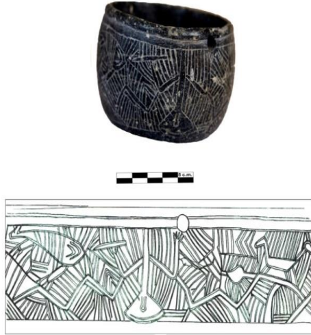
الشكل 2: مشهد صيد من تل العبر 3 على إناء من الكلوريت.