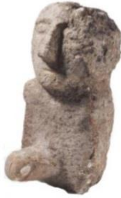
الشكل 5: دمية كبلكي تبه.

(DIETRICH O., DIETRICH L., NOTROFF J. 2019, P. 17.)