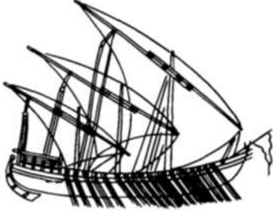
الشكل 2: القادس البحري الحربي. (132)