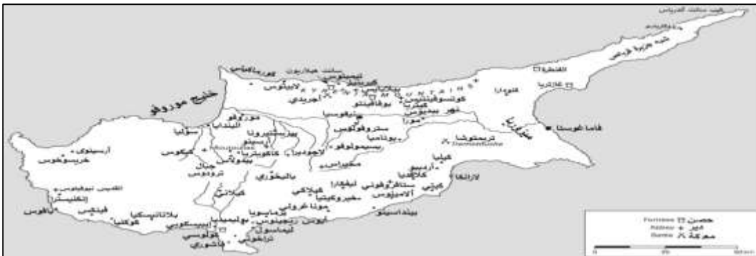
الخريطة 1: مملكة قُبْرُس الفرنجية الصليبية في القرن الثامن الهجري/الرابع عشر الميلادي (128)