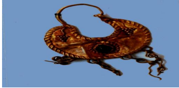
الشكل 7، قرط ذهبي، المتحف الوطني بدمشق