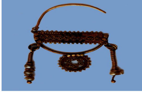
الشكل 1 ، قرط ذهبي ، المتحف الوطني بدمشق