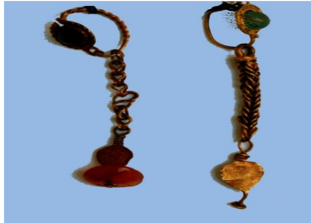
الشكل 5، خزام ذهبي، المتحف الوطني بدمشق