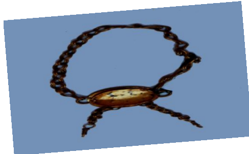
الشكل 9، سوار ذهبي، المتحف الوطني بدمشق