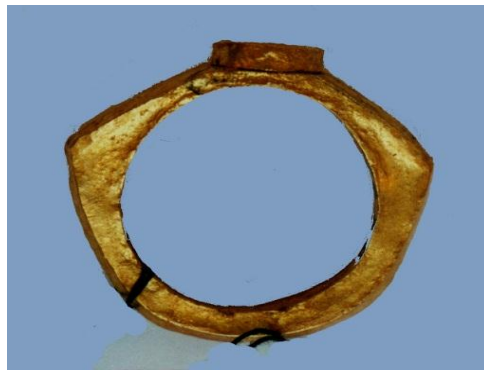
الشكل 3، خاتم ذهبي، المتحف الوطني بدمشق