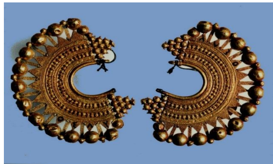
الشكل 6، قرط ذهبي، المتحف الوطني بدمشق