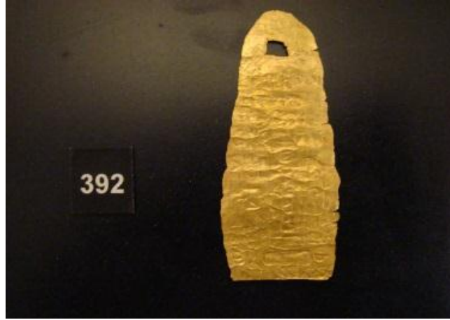
الشكل 4، التميمية الذهبية، المتحف الوطني بحماه، (تصوير قسم التوثيق في المتحف الوطني بحماه)