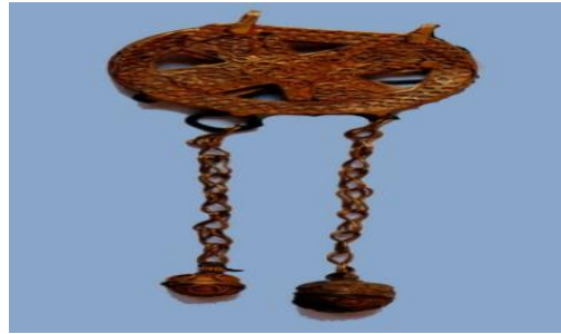
الشكل 8، مشبك حزام، المتحف الوطني بدمشق