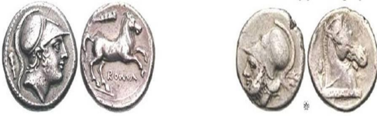
ديدراخما مضمومة عام ٢٤١ ق.م حملت في مركز الوجه رأس الإله مارس وفي مركز الظهر حصان وفوقه هراوة هراقل وفي الأسفل روما (ROMAN)

لم يتوقف الرومان عن خوض تجربتهم في سكّ المسكوكات الفضية فقبل الحرب البونية الثانية بقليل في نحو العام (225ق.م) أصدر الرومان ديدراخما، أُطلق عليها تسمية كوادرجاتوس ( Quadrigratus ) نسبةً إلى صورة العربة الحربية التي تمثّلت في مركز ظهر الديدراخما ويركبها الإله يانوس (حارس بوابات السماء) أو كبير الآلهة (جوبيتر)، وقد استمرّ هذا النموذج من النقود حتّى نحو العام (222ق.م)، ومع نهاية القرن الثالث ق.م جرت بعض التغييرات على الكوادرجاتوس فبدأت تقلّ قيمتها وينقص وزنها وبعد الحرب البونية الثانية (202/218ق.م) توقّف إنتاجها واستُبعدت من التداول، ويبدو أنّ الديناريوس الفضيّ قد أخذ مكانها. فقد استمدّ الديناريوس وزنه والصورة المنقوشة عليه من الديدراخما ذات الأصول الإغريقية التي كانت تزن نحو (4غ)، وقد ضرب الرومان في الربع الأخير من القرن الثالث ق.م عملة فضية أيضًا عُرفت باسم فيكتوريان ( Victorian ) مرتبطة بالنصر الذي اكتسبته من صورة ربة النصر المجحة التي تقوم بتتويج نصبٍ لجندي روماني، وكانت تساوي (9) أس أي ما يمكن تقدير وزنه بنحو (3.4) غ وبقي متداولًا حتّى العام (150ق.م).