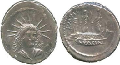
ديناريوس مضروب باسم ميسيلبيوس سنة ٤٢ ق.م. الوزن ٣,١٧ غ في الوجه رأس إله الشمس وفي الظهر سفينة وفوقها الربة فينوس