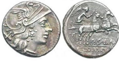
ديناريوس مضروب في العام (١٥١ ق.م) في مركز الوجه رأس الربة روما بخونتها الحربية وفي مركز الظهر الربة فيكتوريا ربة النصر المجنحة تقود عربة. الوزن (٣.٧٦) غ

Carson, 1975: Coins of the World, London.