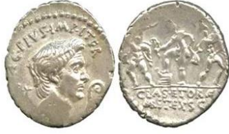
ديناريوس سكستوس بومبيوس ٤٢ ق.م الوزن ٣,٨٦ غ. في الوجه رأس بومبيوس. وفي الظهر مشهد مصارعين