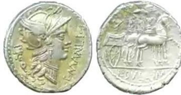
ديناريوس كورنيليوس سولا ٨٢ ق.م الوزن ٣,٨٦ غ. في الوجه رأس روما. وفي الظهر ربة النصر فيكتوريا في عربة