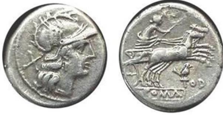
ديناريوس مضروب بين العامين (١٨٩ - ١٨٠ ق.م) في مركز الوجه رأس الرّبة روما بخوذتها الحربية وفي مركز الظهر الإله هيراكلس يقود عربة

وبعد مرور مدة من الزمن غُيِّرَتْ صورة الديوسكورس (كاستر وبوللكس) واستبدلت بها صورة البطل هيراكلس يقود عربة، وهناك مسكوكات فضّية من وحدة الديناريوس حملت صورة الرّبة فينوس (آلهة الحسن والجمال) تركب في عربة تجرّها الخيول ويتوجّها إلى الهب كيبيدون، أو الرّبة ديانا (أرتميس) ربّة الصيد ومعينة النساء عند الوضع تقود عربة، أو تلك التي حملت رمز مدينة روما وشعارها المتمثّل بدبّبة الكابيتول وهي ترضع الطفلين ريموس ورومولوس مؤسسا روما عام (753ق.م)، أو ربّة النصر المجنّحة فيكتوريا تقود عربة مع وجود ثلاثة حروف أمام العربة تشير إلى القضاة الثلاثة المشرفين على عملية السكّ بتكليف من الإمبراطور (4) .