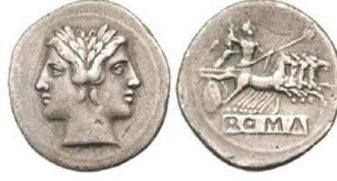
كوادر جلتوس مضروب عام ٢٢٥ ق.م حمل في مركز الوجه رأس الإله ياتوس وفي مركز الظهر عربة يركبها الإله جوبيتر وفي الأسفل روما (ROMAN)