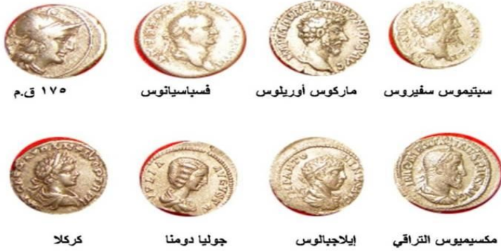
نماذج من وحدة الديناريوس الروماني

Zander, Klawans, 1959. Roman Imperial Coins. 2 edition. Racine.