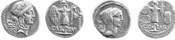
ديناريوس يوليوس قيصر مضروب في الحرب الأهلية الثانية سنة ٤٨ ق.م

دنانير فضية ويوزعها كهبات ومنح وعطايا للجنود لاستمالتهم للقتال إلى جانبه ليستحوذ على العرش، ويكسب بهم تأييد مجلس الشيوخ الروماني لتعيينه حاكمًا.