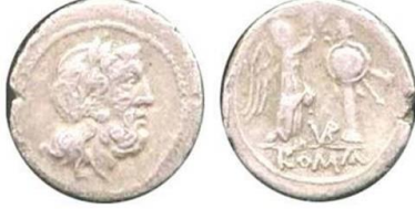
فيكتورياس في مركز الوجه رأس الإله جوبيتر، وفي مركز الظهر فيكتوريا تتوج نصب تذكاري لجندي مضروب عام ٢١١ - ٢٠٨ ق.م وفي الأسفل روما (ROMAN)