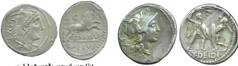
ديناريوس توريوس بلبيوس ١٠٥ ق.م الوزن ٣,٩٠ غ. في الوجه رأس الربة جونو، وفي الظهر ثور

Hollard. Dominique, 1999. Numismatique Grecque, Romaine. Dossiers archéologies.