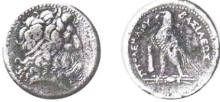
نقد برونزي كبير لبطليموس الثاني مضروب في صور في سنة ٢٨٥ - ٢٤٦ ق.م

كما حملت المسكوكات البرونزية في صور في عهد بطليموس الثاني فيلادلفيوس في مركز الوجه صورة رأس الإله زيوس/أمون، وفي مركز الظهر نقش النسر البطلمي بين مخالبه صورة حيوان الموريكس الصدفى الذي كان الفينيقيون يستخرجون منه الصبغ القرمزي، وأمام النسر نقش هراوة الإله ملقارت سيّد مدينة صور والإله الأكبر فيها مع غياب كتابة اسم المدينة أو رمز كتابي يشير إليها، لكن هراوة ملقارت وحيوان الموريكس أكدا أنّ الإصدار تمّ في صور.