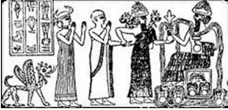
الشكل (6): طبعة ختم تصور إنكي حاملاً ببديّة أوان يتدفق منها الماء

برزت مكانة الماء كأساس للحياة من خلال آلهة أخرى، لا ترقى إلى مكانة إنكي، لكنها كانت مؤثرة في حياة الناس. من بينها ربة الينبوع التي عُثر على تمثالها-العائد إلى العصر البابلي القديم- في قصر ماري الملكي. نُحت التمثال من الحجر الكلسي الأبيض بارتفاع 1,42 م 1 ، يجسد ربة الينبوع تحمل ببديها إناء الماء الفوار، رمز الرخاء 2 ، مرتديّة ثوباً نُقش عليه عددٌ من الأسماك، وبعض الخطوط المتعرجة التي ربما كانت ترمز للأنهار الشكل (7)