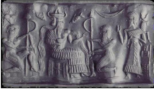
الشكل (4): إنكي جالس على عرشه في معبد تحت الماء

(عن http://www.abualsoof.com/inp/view.asp?ID=595 )