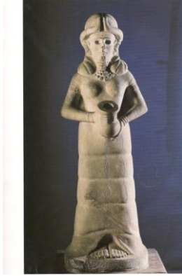
الشكل (7): تمثال ربة الينبوع المكتشف في قصر ماري الملكي (عن Margueron J-C., 2004, pl. 67)

برزت مكانة الماء كأساس للحياة من خلال آلهة أخرى، لا ترقى إلى مكانة إنكي، لكنها كانت مؤثرة في حياة الناس. من بينها ربة الينبوع التي عُثر على تمثالها-العائد إلى العصر البابلي القديم- في قصر ماري الملكي. نُحت التمثال من الحجر الكلسي الأبيض بارتفاع 1,42 م 1 ، يجسد ربة الينبوع تحمل ببديها إناء الماء الفوار، رمز الرخاء 2 ، مرتديّة ثوباً نُقش عليه عددٌ من الأسماك، وبعض الخطوط المتعرجة التي ربما كانت ترمز للأنهار الشكل (7)