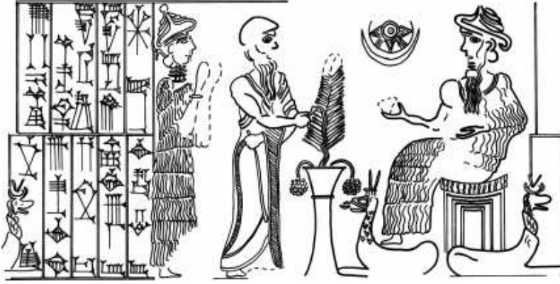
الشكل (3): أوزو رواسو يسكب ماء مقدسا في وعاء أمام أحد الآلهة (عن عبد الحق، 2013، الشكل 3)