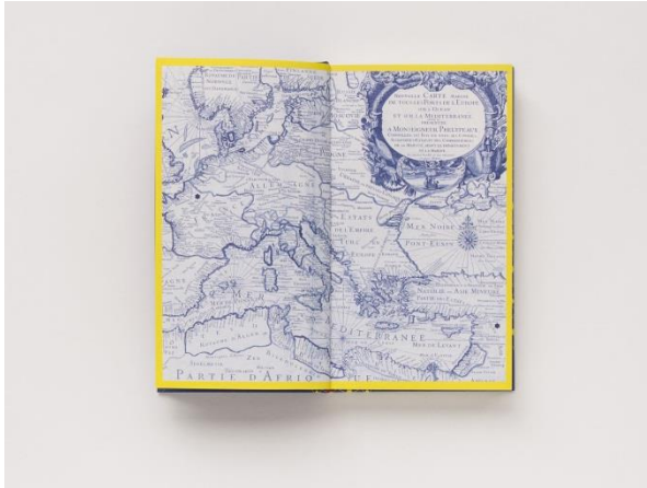
خريطة رحلة حنا دياب كما أوردتها الطبعة الألمانية