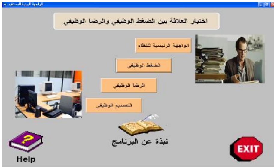
الشكل ١ الواجهة الرئيسية للنظام