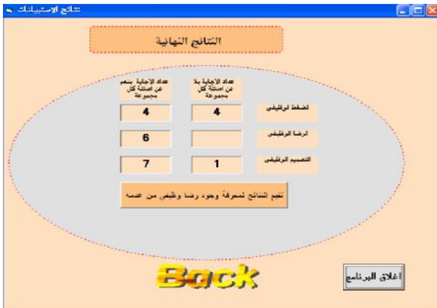
الشكل ٦ واجهة النتائج النهائية