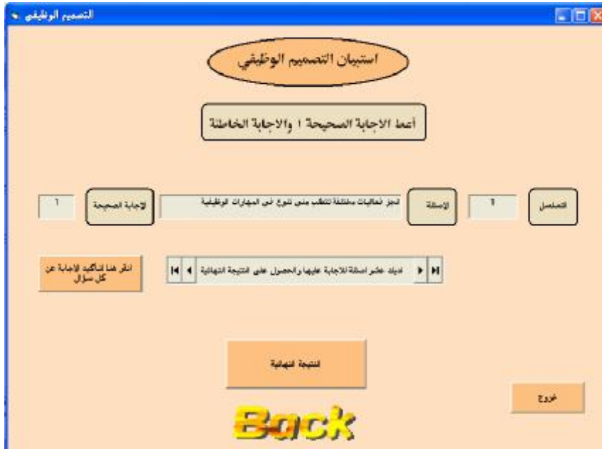
الشكل ٥ واجهة اسئلة استبيان التصميم الوظيفي