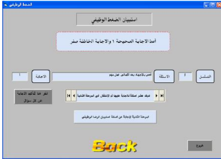
الشكل ٣ واجهة اسئلة استبيان الضغط الوظيفي