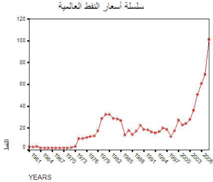
الشكل ١-٣ سلسلة أسعار النفط العالمية

والشكل أعلاه يمثل التوقع البياني لأسعار النفط العالمية لغاية ٢٠٠٨. وواضح في الشكل أعلاه أن هناك اتجاه تصاعدي لأسعار النفط العالمية قد حدث في المدة نفسها التي تصاعدت فيها أسعار الحبوب ومنها أسعار القمح. ولبناء أنموذج دالة التحويل لمتغير الإدخال الذي يمثل التدخل المتقاطع I_t ويرمز له كمتغير إدخال X_t وإخراج منفرد Y_t ، التي تمثل السلسلة الرئيسية قيد الدراسة، التي تحتوي على التدخل المتقاطع أو ما يسمى الدالة المتدرجة Step Function أي (بداية متدرجة وأثر دائم للتدخل) الذي يمكن كتابته بالصيغة الآتية :