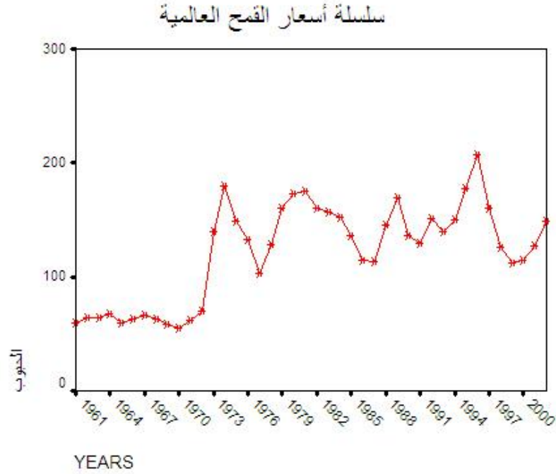
الشكل ٢-٣ سلسلة أسعار القمح العالمية

الشكل أعلاه يمثل الأسعار العالمية للقمح من ١٩٦١ لغاية ٢٠٠٢ ومراحل العمل تكون على النحو الآتي :