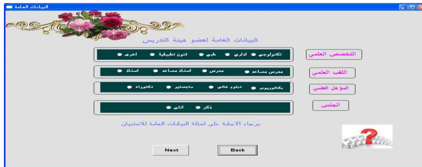
الشكل ٢ نافذة البيانات العامة لعضو هيئة التدريس

تم إجراء اختبار البرنامج بشكل أولي على عينة مكونة من (١٠) من أعضاء هيئة التدريس وباختصاصات مختلفة وأعطت مصداقية بنسبة (٧٥%). يتكون البرنامج المصمم كما في الشكل ١ من عدد من النوافذ تتضمن البيانات العامة لعضو هيئة التدريس من حيث التخصص العلمي واللقب والمؤهل العلمي والجنس كما يظهر في الشكل ٢.