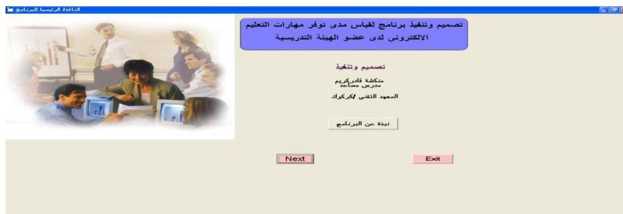
الشكل ١ الواجهة الرئيسية للبرنامج المصمم من قبل الباحثين

تم إجراء اختبار البرنامج بشكل أولي على عينة مكونة من (١٠) من أعضاء هيئة التدريس وباختصاصات مختلفة وأعطت مصداقية بنسبة (٧٥%). يتكون البرنامج المصمم كما في الشكل ١ من عدد من النوافذ تتضمن البيانات العامة لعضو هيئة التدريس من حيث التخصص العلمي واللقب والمؤهل العلمي والجنس كما يظهر في الشكل ٢.