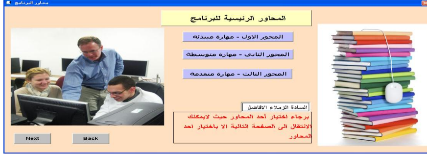
الشكل ٣ المحاور الرئيسية للبرنامج

ويحتوي كل محور على (٥٠) سؤالاً مرتبة بحسب درجة صعوبتها لكل مستوى من المحاور، كما في الشكل ٤.