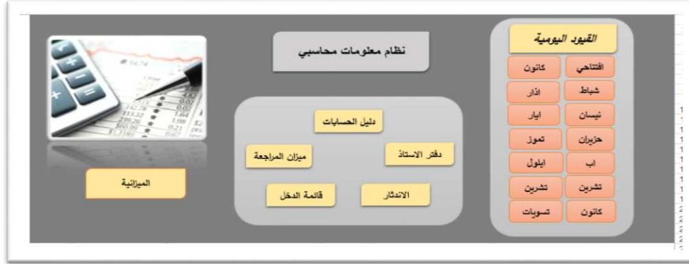
الشكل (٣): واجهة نظام المعلومات المحاسبي