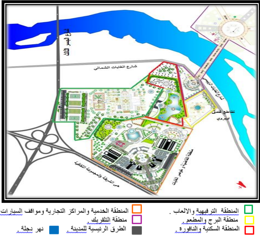
شكل (٢): خارطة مشروع مُتَنَزَّه الموصل السياحي

The map was executed by the architect Abdel-Ilah , Othman Imad and the architect Al-Nuaimi, Lama Adib Hussein.