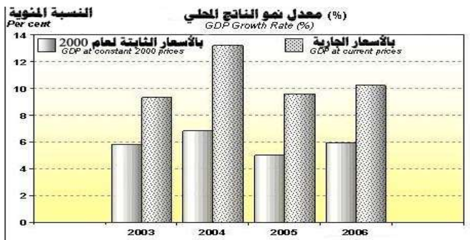
الشكل رقم(2): معدل نمو الناتج المحلي