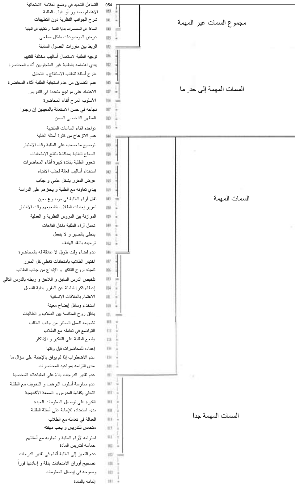
الشكل رقم(2) يوضح المخطط البياني للعبارات لـ 55 للتحليل التجميعي التدريجي باستخدام معامل التباين كاي مربع في كلية الاقتصاد