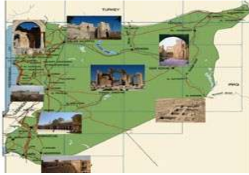
الشكل رقم (2) خريطة سوريا السياحية