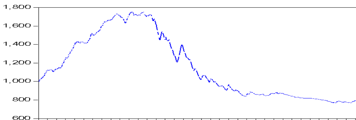
الشكل رقم (1): شكل توضيحي لأسعار إغلاق مؤشر سوق دمشق للأوراق المالية منذ 2009/12/31 لغاية 2013/4/16

ويبين الشكل رقم (1) المخطط البياني لمؤشر السوق خلال فترة الدراسة، وفيه نلاحظ مستوى التذبذب العالي لأسعار الإغلاق في السوق، وفيه يأخذ الانحراف المعياري القيمة (333.9) وهي قيمة مرتفعة بالمقارنة مع الشكل رقم 2 الذي يبين المخطط البياني لعوائد مؤشر السوق الذي يأخذ فيه الانحراف المعياري القيمة (0.007674).