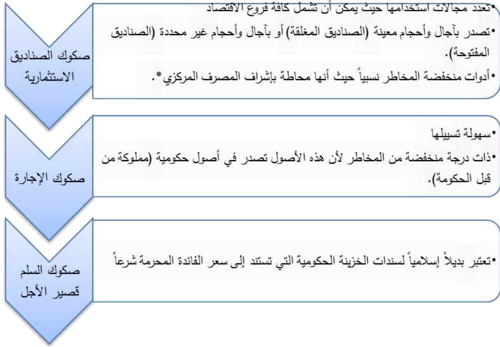
الشكل (2) أنواع الصكوك في المصارف [17]

2- أسهم الشركات الحكومية وغير الحكومية: يمكن بيع هذه الأسهم والتصرف فيها في أي وقت ضمن السوق المالية، وتسعى المصارف الإسلامية عادة إلى استثمار أصولها في أسهم الشركات التي تتمتع بسمعة ممتازة حتى تكون قادرة على بيع هذه الأسهم بسهولة في السوق المالية عند الحاجة إلى السيولة [10].