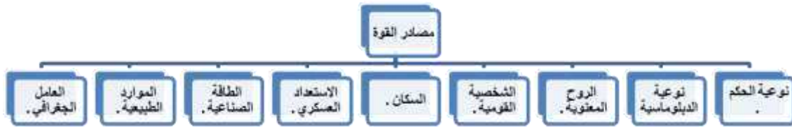
شكل رقم (2): عناصر القوة الشاملة للدولة حسب بعض مفكري العلاقات الدولية

القوة هي القدرة في التأثير على الآخرين، وإن المجتمع أو الدولة القوية هما القادران على التأثير في الآخرين ويعمل الآخرون من الدول والمجتمعات لها حساباً. فلا بد أن تكون لهذه الدولة مقومات تضطر المجتمعات والدول الأخرى للخضوع لها فما هي مصادر القوة عند هذه الدولة القوية أو ذلك المجتمع المؤثر؟ أولاً: مصادر القوة: