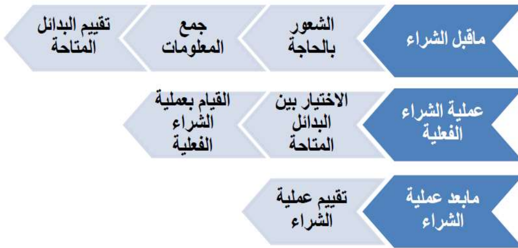
الشكل (2) خطوات اتخاذ القرار الشرائي للمستهلك

يمر المستهلك حتى يتخذ قراره بشراء المنتج بعدة مراحل يوضحها الشكل الآتي: