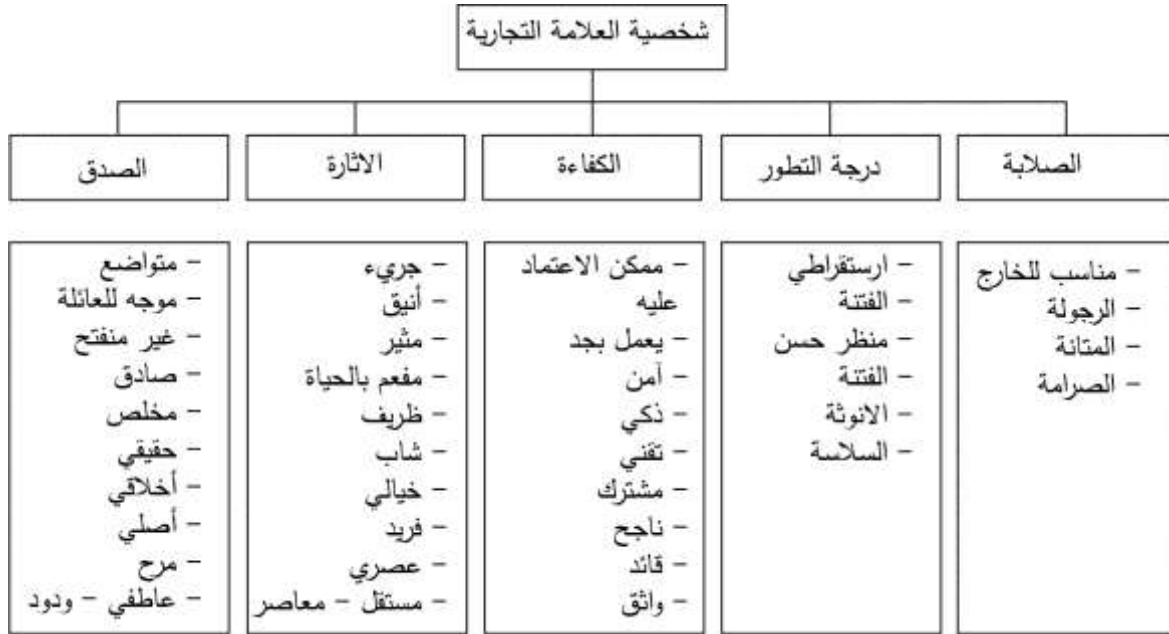
الشكل (1): نموذج Aaker المعدل لشخصية العلامة التجارية

من عدد من المكونات ويبلغ مجموع هذه المكونات 15 مكوناً. وقد قام (Fetscherin and Toncar, 2010) بإعادة دراسة هذا النموذج بعد أن أضاف مكونات جديدة لهذه الأبعاد وأصبح مجموع هذه المكونات 42 مكوناً كما في الشكل (3-5):