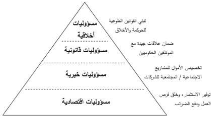
هرم Visser لمسؤولية الشركات الاجتماعية في البلدان النامية