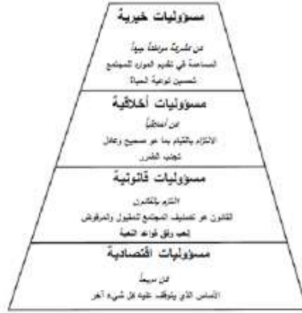
هرم Carroll لمسؤولية الشركات الاجتماعية

أصبح مفهوم مسؤولية الشركات الاجتماعية بالتسعينات مقبولاً عالمياً ومدعوماً من قبل جميع مكونات المجتمع من حكومات وشركات إلى مستهلكين ومنظمات غير حكومية، ومنظمات دولية (Moura-Leite & Padgett, 2011) ويتتالي الأبحاث والدراسات استطاع Carroll عام 1991 تقديم شكل هرمي يصوّر المكونات الأربعة لمسؤولية الشركات الاجتماعية، إذ يعرض فيه التسلسل الهرمي للمسؤوليات بدءاً من المسؤوليات الاقتصادية والقانونية انتقالاتاً إلى المسؤوليات الأخلاقية والخيرية ذات التوجّه الاجتماعي الأكبر.