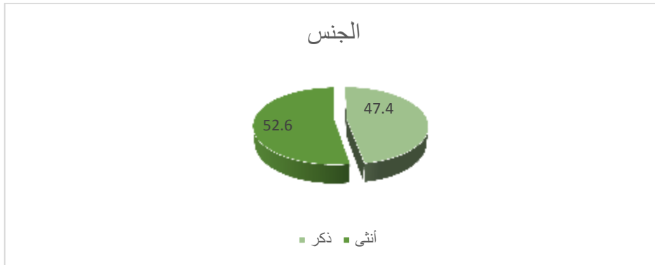
الشكل (1) التوزيع النسبي لعينة الدراسة حسب الجنس

والشكل (1) يظهر التكرارات الإحصائية لأفراد العينة حسب الجنس: