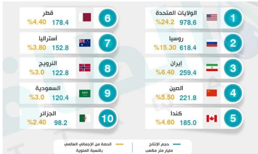
شكل (٣) يوضح الدول الـ ١٠ الأعلى إنتاجاً في العالم لعام ٢٠٢٢