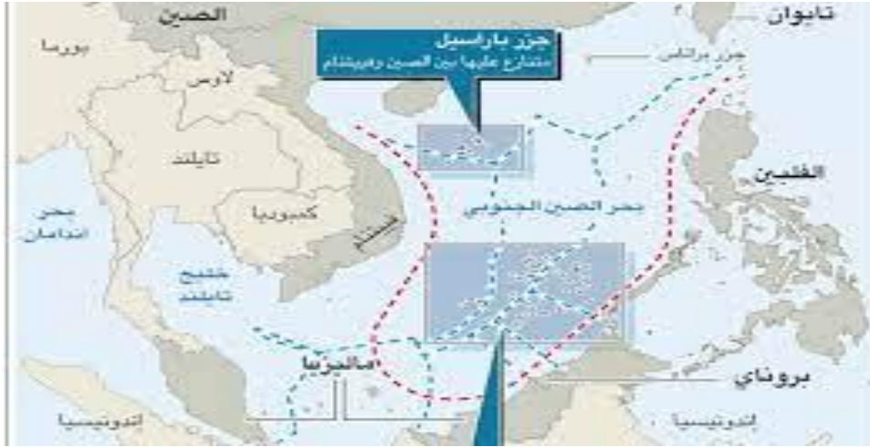
الشكل (1) خريطة بحر الصين الجنوبي

يمثل بحر الصين الجنوبي جزء من المحيط الهادي، ويشمل المنطقة الممتدة من سنغافورة ومضيق ملكا وصولاً إلى مضيق تايوان، وتبلغ مساحة المسطح المائي للبحر الأسود (3500000) كم مربع، ويطل عليه ثمان دول هي: الصين- فيتنام- الفلبين- تايوان- ماليزيا- إندونيسيا- سنغافورة- وبروناي، وتحديداً يقع البحر في جنوبي البر الصيني الرئيسي، ويتضمن جزيرة تايوان من جهته الشرقية، وفي الغرب من الفلبين، وشرقاً شبه جزيرة ماليزيا وسومترا، وغرباً مضيق ملقا، كما يقع في الجهة الشمالية لجزر بانغا وبليتونغ وبورتو (International hydrographic organization, limits of oceans and seas, 1953, pp (30-31).