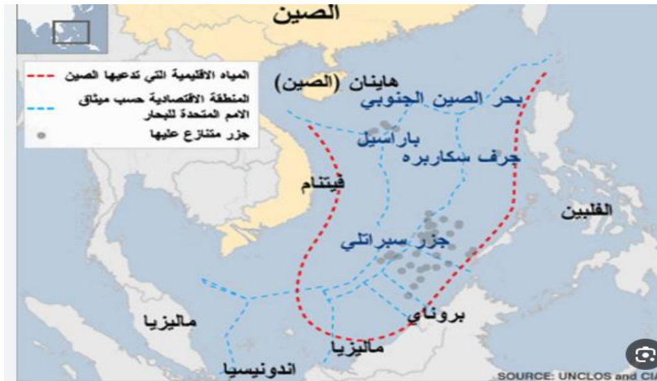
الشكل (3) توزع الجزر العسكرية الصينية في بحر الصين الجنوبي

والخريطة التالية تبين توزع الجزر الصناعية الصينية في بحر الصين الجنوبي