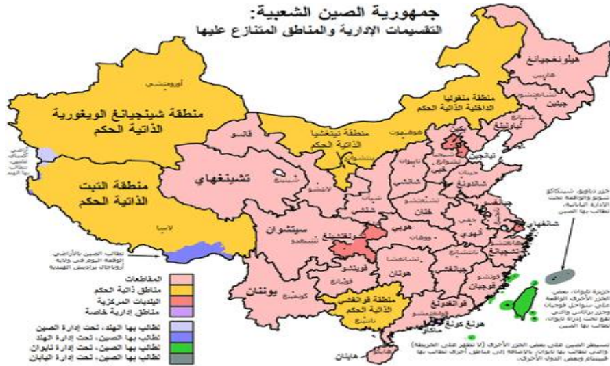
الشكل (2) خريطة الصين الإدارية

ومن الناحية البشرية يبلغ تعداد سكان الصين في الوقت الراهن حوالي 45.1 مليار نسمة، أي ما يعادل 21% من التعداد العالمي للسكان في العام 2023، ومن بينهم حوالي 71% سكان نشيطين (ضمن سن الإنتاج المعتمد دولياً)، ويصل أمد الحياة إلى 72 سنة، وتتمركز الكثافة المرتفعة بالقسم الشرقي من البلاد، تقدم هذه الثروة السكانية اليد العاملة الخبيرة والطاقات البشرية المؤهلة للأنشطة الاقتصادية الصينية، فضلاً عن كونها سوقاً استهلاكية كبيرة (عادل، مدحت، 2023، https://www.youm7.com/story/2023/7/12/ ).