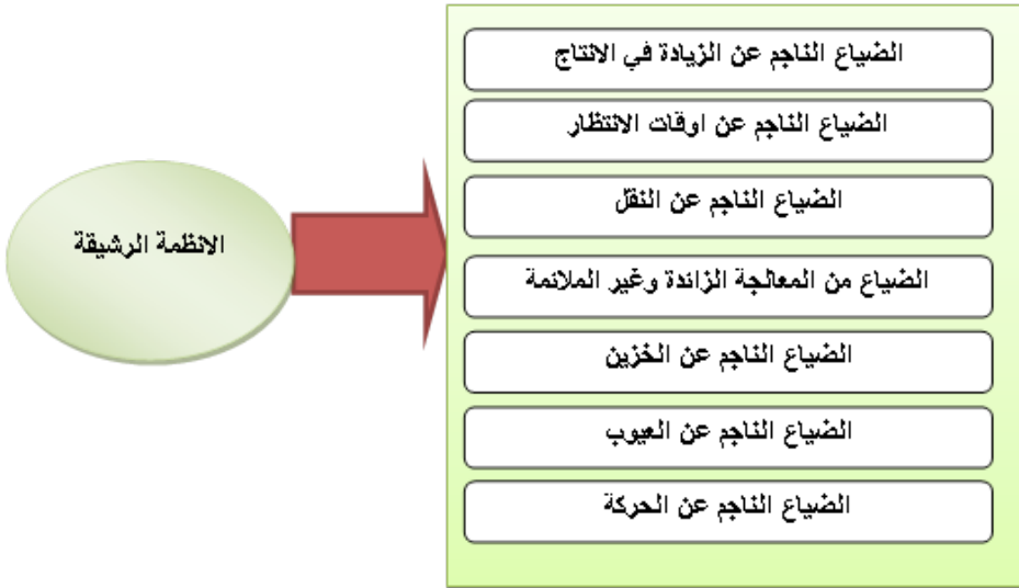
شكل (2) أنواع الضياعات السبعة

إن المبدأ الرئيس الذي لا لبس فيه هو أن في الإنتاج الرشيق يعني تقليل التكلفة من خلال التحسين المستمر الذي يؤدي في النهاية الأمر إلى تقليل تكلفة الخدمات والمنتجات، ومن ثم يزيد من الأرباح وتركز الرشاقة على محو أو تقليل الضياعات أو الهدر وعلى رفع أو استخدام بشكل كامل النشاطات والفعاليات تلك التي تضيف قيمة من وجهة نظر الزبون، وهي القيمة التي تكافئ أي شيء يرغب به الزبون في الدفع لقاءه سواء كان في شكل منتج أو خدمة وعليه يعد التخلص من الهدر المبدأ الأساس في الإنتاج الرشيق (Abdullah:2003) وكما أشار لها (Byron: 2008) في الشكل (2).