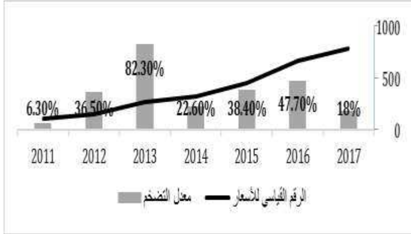
الشكل (2): الرقم القياسي لأسعار المستهلك ومعدل التضخم خلال الفترة 2011-2017

مصدر البيانات: المكتب المركزي للإحصاء، أسعار 2010 سنة الأساس