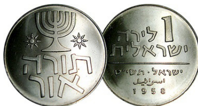
(شكل رقم 53)

http://coinquest.com/cgi-bin/cq/coins?main_coin=14998