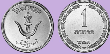
(شكل رقم 4)

http://swapmeetdave.com/Coins/Israel/KM9-1949.jpg