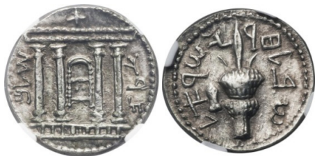
(شكل رقم 54)

http://www.numisbids.com/n.php?p=lot&sid=611&lot=23821