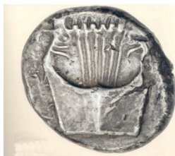
(شكل رقم 59)

http://www.ancientlyre.com/the_biblical_kinnor