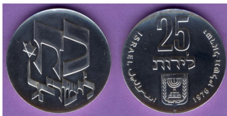
(شكل رقم 57)

http://swapmeetdave.com/Coins/Israel/KM85-1976-proof.jpg