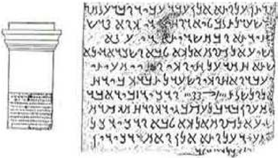
نقش رقم 2: نسخ لنقش دون على مذبح قُدم لشيع القوم في تدمر؛ علي، صقر أحمد: النقوش التدميرية. ص186.