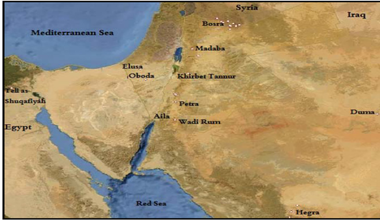
لخريطة رقم (1): مواقع الاستقرار النبطي (Alpass 2013: 311)

خريطة رقم 1: مواقع استقرار القبائل النبطية جنوبي الأردن؛ النصرات والجازي: الجريمة والعقاب عند الأنباط. ص3.