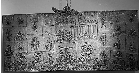
الشكل (2) جدارية خزفية بأسلوب البلاطات المنتظمة. للفنان رعد الدليمي، 2018.

هذا الأسلوب يستخدم بكثرة بين الخزافين، ويعتمد على تشكيل الجدارية الخزفية بشكل هندسي منتظم حيث يتم فرد الشريحة وباستخدام المساطر الخشبية يتم قصها بشكل منتظم وتركب بجانب بعضها مكونة لوحة متماسكة (رشدي، وآخرون، 2019)