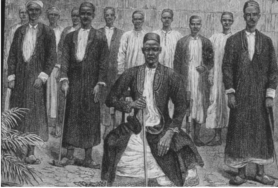
ملحق رقم (4): صورة للكاباكا موتيسا وحاشيته وفق ما وصفه ستانلي في العام 1875

Robinson, Muslim Societies in African History, p159.