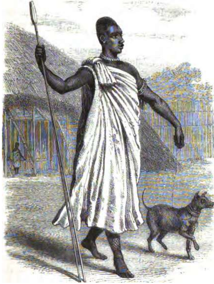
ملحق رقم (3) صورة للكاباكا موتيسا كم وصفه سبيك في العام 1862

Speke, Journal of Discovery of the Source of the Nile, p285