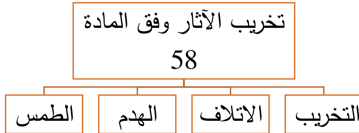
الشكل (5) تخريب الآثار وفق قانون الآثار السوري