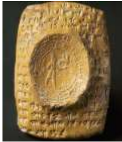
الشكل رقم (4)

2. الشكل رقم (4) يمثل رقيم مسماري عبارة عن مرسوم ملكي أصدره الملك الحثي تودخاليا الرابع إلى انيتشوب ملك كركميش ونائبه في سورية، قراره القطعي بإعفاء ملك أوجاريت من تقديم المساعدات