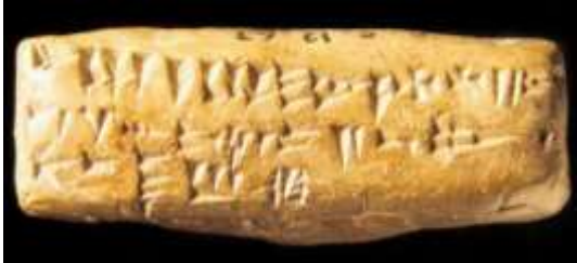
الشكل رقم (3)

هذا وإن من أبرز المعالم الأثرية المكتشفة في أوجاريت مايلي: القصر الملكي الكبير والقصر الشمالي 7 والقصر الجنوبي الصغير والبيوت الكبيرة وبيت الألاباستر والبيوت الجنوبية وشمال وجنوب الأكروبول ومنزل ومكتبة رعبانو ومنزل راشابابو 8 وبيت كبير الكهنة 9 والمدافن ومعبد بعل ومعبد دجن