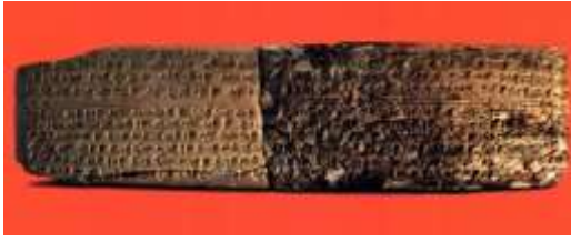
الشكل رقم (5)

العسكرية خلال حروبه مع شلمناصر الأول ملك آشور، ومقابل هذا الإعفاء عليه دفع خمسين مينا ذهباً. وقد مهر هذا الرقيم بطبعة الختم الخاص بالملك انيتشوب. وهذا الرقيم يدل على التحالفات الدولية بين هذه الممالك.