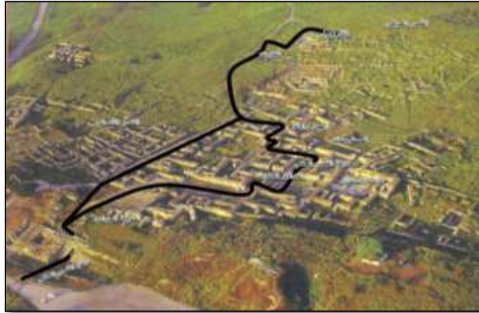
الشكل رقم (8)

البدء من المدخل ومنه إلى القصر الملكي ثم غرفة الحرس ومنها إلى المكتبة الملكية ثم القبر الملكي وصولاً لقاعة الاستقبال والتشريفات ثم حديقة القصر الملكي وبعدها المستودعات ثم بيت رابانو ومدفنه وصولاً للأكروبول حيث معبد دجن ومعبد بعل ومن الأكربول يتم التوجه لزيارة القصر الشمالي وذلك في طريق العودة للخروج من مدخل الموقع. الشكل رقم (8)