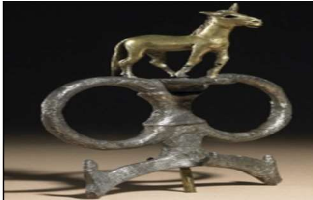
الشكل (6): جزء من الشكيمة المتصلة بالجام عبر الحلقات