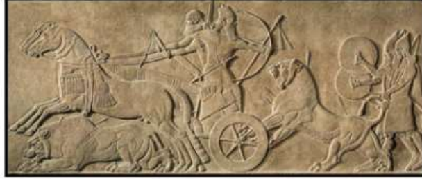
الشكل (2) البياتي، د، ت، 184.

عندما كانت الذبائح المضحاة تنظم في اهتمام، وقد حدد جوديا عدد الأسماك والثيران والنعاج والحملان والخيل التي يضحى بها في معابد لاجاش باسم المدينة لمناسبة أعياد السنة المهمة (دوبلابوت، 1997م، 146) ورد اسم الخيل في النصوص المسماة بالصيغة (ANSE-KUR,RA) وبالأكادية (Sisu) (AHW, P.1250)، ويعني ذلك حمار الجبال (Nejat, K,R,N,2000,251)، مما يؤكد أنه لم يكن حيواناً محلياً، بل حيواناً أجنبياً تم جلبه من مناطق التي تقع خلف السلاسل الجبلية المحيطة ببلاد الرافدين، وحسب المعلومات المتوفرة التي تشير إلى أن الحصان قد تمت عملية تدجينه، واهتمام بتربيته منذ عهد سلالة أور الثالثة حيث ورد ذكر الحصان في ترتيلة الملك شولجي 1 حيث وصف نفسه بصفات الحصان (( أنا الحصان الذي يتموج ذيله في الطريق)) (سعيد، 2008م، 35)