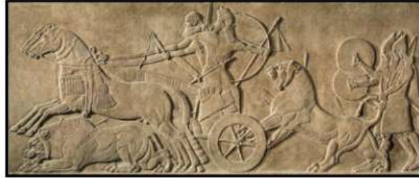
الشكل (2) البياتي، د، ت، 184.

عندما كانت الذبائح المضحاة تنظم في اهتمام، وقد حدد جوديا عدد الأسماك والثيران والنعاج والحملان والخيل التي يضحى بها في معابد لاجاش باسم المدينة لمناسبة أعياد السنة المهمة (دوبلابوت، 1997م، 146) ورد اسم الخيل في النصوص المسمارية بالصيغة (ANSE-KUR,RA) وبالأكادية (Sisu) (AHW, P.1250)، ويعني ذلك حمار الجبال (Nejat, K,R,N,2000,251)، مما يؤكد أنه لم يكن حيواناً محلياً، بل حيواناً أجنبياً تم جلبه من مناطق التي تقع خلف السلاسل الجبلية المحيطة ببلاد الرافدين، وحسب المعلومات المتوفرة التي تشير إلى أن الحصان قد تمت عملية تدجينه، واهتمام بتربيته منذ عهد سلالة أور الثالثة حيث ورد ذكر الحصان في ترتيلة الملك شولجي 1 حيث وصف نفسه بصفات الحصان (( أنا الحصان الذي يتموج ذيله في الطريق)) (سعيد، 2008م، 35)