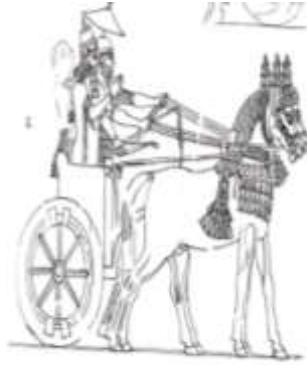
الشكل (8) إسماعيل ، 2018م ، 664

ورافعاً يده اليمنى، وخلفه شخص يحمل مظلة.(الشكل 8)