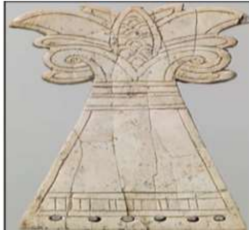
الشكل (4) محمد، 2018م، 133

زخارف بين الهندسية والنباتية والمجسمة، حيث عُثِر في مدينة النمرود بأحد مخازن الجزية للملك آشور ناصر بال الثاني غرفة (SW-37) قطعة رقم (ND9376) تتضمن زخارفها براعم الزهور وأوراق النباتات (محمد، 2018م، 132) (الشكل 4)،