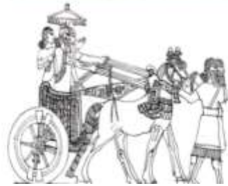
الشكل (7) إسماعيل، 2018م، 663.

وفي مدينة دور شروكين(خرسباد) 1 وجدت منحوتة تصور الملك شروكين الثاني على عربة ملكية، ويحمل بيده اليسرى القوس،