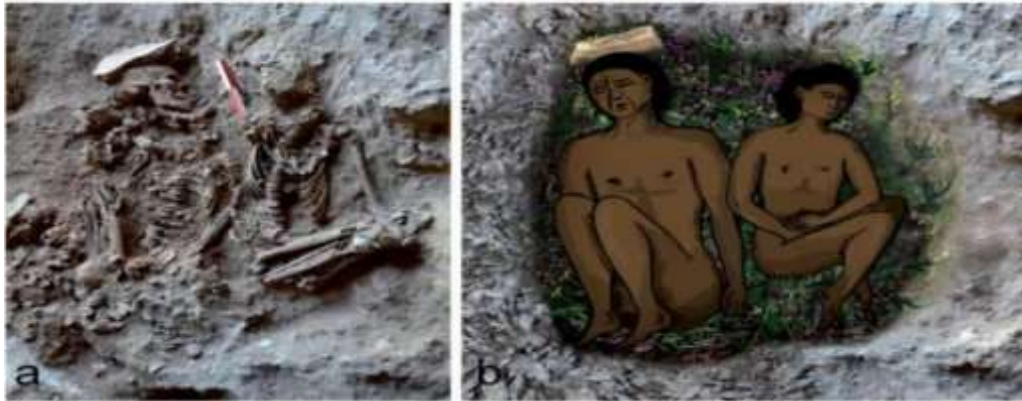
الشكل (7) يبين الهيكلان من موقع رقت كما هما لحظة الاكتشاف، مع صورة توضيحية لوضعية الدفن (Nadel, et al., 2013, 2).