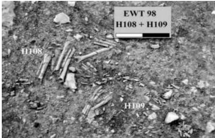
الشكل (1) الهياكل H108 و H109 من موقع الواد في فلسطين (Bachrach, et al., 2013, 107-117).