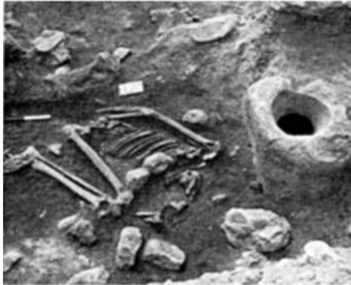
الشكل (5) الهيكل H21t من موقع وادي الفلاح في فلسطين (Bocquentin, 2003, 168-180).

4- موقع عين الملاحه: يقع في فلسطين في وادي الحولة، قرب نبع ماء يحمل الاسم نفسه، أعلى وادي الأردن، وهي نموذج للمواقع النطوفية المكتشفة (أي ليست كهف) ويبعد 20 كم شمال شرق كهف الحمام، تبلغ مساحته حوالي 2000 متر مربع. تم الكشف عن الموقع في الخمسينيات من القرن الماضي تحديدا عام 1954م أثناء عملية شق طرق، وبين عامي 1955-1961م قام جان بيرو (J.Perrot) بالإشراف على التنقيبات الإنقاذية في الموقع، وبين عامي 1972-1976م جرت التنقيبات تحت إشراف كل من جان بيرو ومونيك لوشفالييه (M.Lechevallier) وفرانسوا فالأ (F.Valla)، وبين عامي 1996-2005م تم التنقيب في الموقع تحت إشراف كل من فرانسوا فالأ وحمودي خلايلي (H.Khalaily)، وقد عثر على ثلاثة سويات تضمنت بقايا الثقافة النطوفية (Valla, et al., 2017, 295-302)، في هذا الموقع تم العثور على ثلاث حالات دلت على وجود عقيدة عبادة