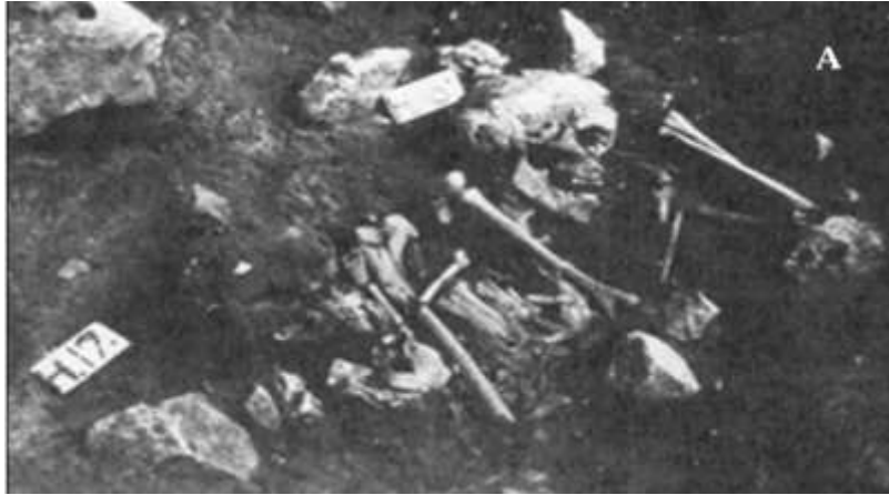
الشكل (4) الهيكل H17t من موقع وادي الفلاح في فلسطين (Bocquentin, 2003, 168-180).