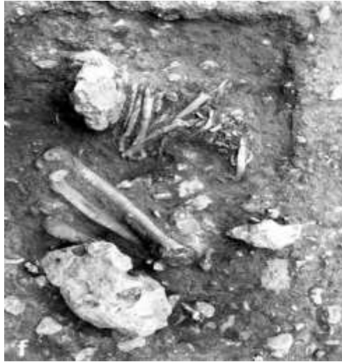
الشكل (2) الهيكل H125 من موقع الواد في فلسطين (Bachrach, et al., 2013, 107-117).

2- موقع عرق الأحمر: مأوى صخري يقع في فلسطين في وادي خريطون على بعد حوالي 8 كم جنوب شرق بيت لحم، وقد كان أول من نقب في هذا الموقع عالم الآثار رينيه نوفيل (R.Neuville) عام 1934م حيث كان هذا الموقع أحد سلسلة المواقع التي قام بمسحها بين عامي 1928-1933م، ثم توقف التنقيب في الموقع على خلفية قيام الحرب العالمية الثانية، وفي عام 2000م أعيد التنقيب في الموقع على يد كل من جيمس فيليبس (J.Phillips) وإيمان ساكا (I.Saca) (Phillips, et al., 2000, 17-18)، وقد عثر في هذا الموقع على أقدم دليل على عملية فصل جماجم عائدة للفترة النطوفية في بلاد الشام (الحايك، 2021، 88-119)، وذلك ضمن الطبقة 2أ العائدة للمرحلة النطوفية الباكرة، حيث أنه عثر على بقايا ستة أشخاص تمثلت هذه البقايا بالجمجمة فقط ضمن حفرة مستطيلة الشكل بعمق نصف متر، وكانت عبارة عن جماجم لثلاثة أطفال وثلاثة بالغين ولكن لم يتم تحديد جنسهم، وقد ضمت تلك الحفرة هيكل عظمي مكتمل يعود لأثنى بالغة وقد وضعت الجماجم حول هذا الهيكل ووضع بجانب كل جمجمة سن حسان، وقد تم دفنهن داخل المأوى أي ضمن المسكن (أبو غنيمه، 1998، 97-121)، ولا شك أن هذا الدفن المميز يدل على نوع من الطقوس الخاصة بعبادة الأموات حيث أن مجتمعات ما قبل التاريخ آمنت بوجود قوة روحية لموتاهم فتم صف تلك الجماجم حول الهيكل كنوع من القدسية والاحترام والحماية.