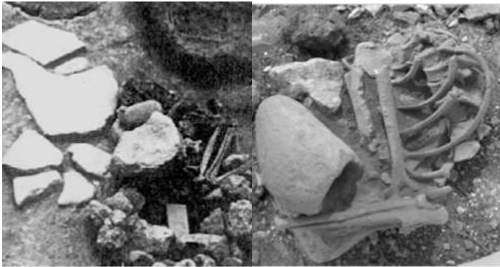
الشكل (3) الهيكل H14t من موقع وادي الفلاح في فلسطين (Bocquentin, 2003, 168-180).

(5-25)، عثر فيها على بقايا 50 قبراً تقريباً، وذلك ضمن الطبقات التي تعود للمرحلة ما بين النطوفية المتأخرة والنهائية، ومن ضمن هذه الدفنات كان هناك ثمانية أفراد دلت على وجود عادة عبادة الأموات، وهي الهيكل H4 وقد تم تمثيله بأجزاء من الجمجمة بالإضافة لبعض العظام الطويلة، ويعود لبالغ غير محدد جنسه عمره تقريباً 30 عام، الهيكل H7t وقد تم تمثيله بأجزاء من الجمجمة وبعض العظام الطويلة، ويعود لإمرأة بالغة، الهيكل H10 تم تمثيله بالجمجمة بالإضافة لبعض العظام الطويلة، ويعود لبالغ غير محدد الجنس، الهيكل H11 وهو عبارة عن جمجمة مجزأة تعود لطفل عمره 5-9 سنوات، الهيكل H14t وهو عبارة عن هيكل عظمي منزوع الجمجمة ويعود لبالغ غير محدد جنسه (الشكل 3)، الهيكل H17t تم تمثيل هذا الهيكل بالجمجمة والعظام الطويلة (الشكل 4)، ويعود لبالغ عمره تقريباً 30 سنة غير واضح جنسه، الهيكل H21t وهو عبارة عن هيكل منزوع الجمجمة ما عدا الفك السفلي (الشكل 5)، ويعود لبالغ غير واضح جنسه، الهيكل H23 وقد تم تمثيله بالجمجمة وبعض العظام المحورية، ويعود لبالغ عمره تقريباً 30 سنة غير واضح الجنس، أما بالنسبة للهيكل الأخرى فقد كانت كاملة أو شبه كاملة ولم يطبق عليها طقوس عبادة الأموات (Bocquentin, 2003, 168-180)؛ (Crognier, et al., 1974, 103-121)، وفي هذا الموقع تعددت أشكال التعبير عن عبادة الأموات من خلال العينات المدروسة آنفة الذكر ولكن يبقى المحور الأساسي لهذه العقيدة هو الجمجمة وما يطبق عليها من طقوس إما بإزالتها بمفردها أو مع بعض العظام أو بعزلها بمفردها أو مع بعض العظام الأخرى.