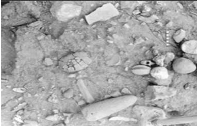
الشكل (6) الهيكل H102 من موقع عين ملاحه في فلسطين (Bocquentin, 2003, 233-269).

الأموات وهي، الهيكل H37 وقد تم تمثيله بالجمجمة وكان متصل بها الفقرتين الرقبيتين الأولى والثانية وقد حملت الفقرة الثانية آثار عملية قطع يدوي، مما يدل على أن عملية فصل الجمجمة تمت عن عمد وتعود هذه الجمجمة لشاب بالغ يبلغ من العمر تقريباً 30 عام وقد عثر عليه ضمن أرضية المسكن 1، وأيضاً الهيكل H102 وهو عبارة عن جزء من قحف جمجمة ويعود لبالغ غير محدد عمره وقد وجد بحالة حفظ جيدة حيث عثر عليه فوق أرضية المسكن 131 (الشكل 6)، وقد عثر عليهما ضمن إحدى الطبقات العائدة للفترة النطوفية الباكرا (Bocquentin, et al., 2001, 89-106)؛ (Bocquentin, 2003, 233-269)، وأيضاً الهيكل H169 وهو عبارة عن أجزاء من جمجمة طفل وتعد هذه الجمجمة حالة خاصة وغامضة إذ عثر عليها بعيداً عن المساكن ضمن الحصى، وقد عثر عليها ضمن الطبقة العائدة للفترة النطوفية النهائية، أما بالنسبة للهيكل الأخرى التي تم اكتشافها فقد وجدت كاملة أو شبه كاملة إلا أنها احتفظت جميعها بالجماجم ولم يتم إزالتها (Bocquentin, 2003, 233-269)، وقد تبين من الهيكل 37 أن عملية فصل الجمجمة تم عن عمد وهذا يؤكد أن إزالة الجمجمة لم يتم بمحض الصدفة ولا أنها أزيلت عبثاً دون هدف من ذلك وإنما تم إزالتها من أجل طقوس معينة تعبر عن عقيدة تلك المجتمعات وإيمانهم بموتاهم.