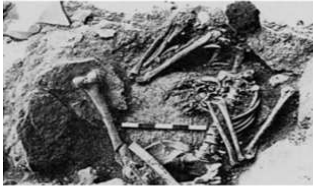
الشكل (8) الهيكل H29a من موقع كهف الحمام في فلسطين (Bocquentin, 2003, 222-231).

لذكر بالغ، الهيكل H36 وقد تم تمثيله بالفك السفلي فقط ويعود لبالغ غير محدد جنسه، الهيكل H36a وقد تم تمثيله أيضا بالفك السفلي ويعود لبالغ غير محدد جنسه، الهيكل H36b وقد تم تمثيله بالفك السفلي مع بعض العظام الطويلة، ويعود لبالغ غير محدد جنسه، الهيكل H36c ويمثل هيكل عظمي منزوع الجمجمة ويعود لطفل غير محدد عمره، الهيكل H37 ويمثل هيكل عظمي منزوع الجمجمة ما عدا الفك السفلي، ويعود لامرأة بالغة تبلغ من العمر بين 45-50 عام (Belfer-Cohen, 1988, 297-308)، إن جميع العينات السابقة تم العثور عليها ضمن الكهف بالإضافة إلى عينة وحيدة من الشرفة وهي الهيكل H1 وقد تم تمثيله بالفك السفلي فقط ويعود للفترة النطوفية المتأخرة (Bocquentin, 2003, 222-231)، أما بالنسبة لبقية الهياكل فقد كانت مكتملة أو شبه مكتملة ولم تمارس عليهم شعائر عبادة الأموات، حيث أن هذا الموقع ضم العديد من أشكال التعبير عن عبادة الأموات حيث أن الجمجمة واختلاف الطقوس المطبقة عليها تعد المحور الرئيسي لهذه العقيدة، إما بإزالتها بمفردها أو إزالة بعض العظام معها وإما بدفنها منفردة أو بدفن بعض العظام معها وأحيانا يتم تمثيلها بالفك السفلي فقط.