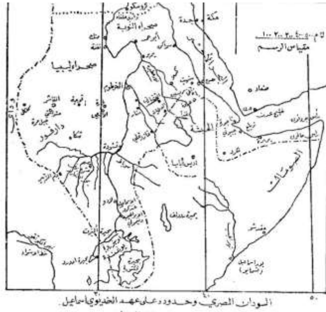
حميدة. (1969)، ص: 121.