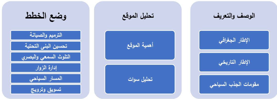
الشكل (1) نموذج مقترح لتخطيط موقع عمريت التراثي

حيث يُعد تطوير التراث الثقافي مصدراً للنشاط الاقتصادي، مثل التوظيف والدخل والإيرادات العامة للاقتصاديات الوطنية والمحلية والعديد من المناطق التي تشهد انخفاضاً في النمو الاقتصادي في حاجة ماسة إلى توجيه استراتيجياتها الاقتصادية نحو استغلال التنمية الاجتماعية والاقتصادية من خلال التراث الثقافي والصناعات الإبداعية كمحرك لتطوير هذه المواقع وتعزيز النشاطات الاجتماعية والثقافية إلى جانب ذلك، يعتبر التغير المناخي والحروب والتحضر تهديداً خطيراً لأصول التراث الثقافي، مما يتطلب تحليل الموقع ووضع خطط فعالة للحفاظ على مواقع التراث في موقع عمريت (Alghafri,2022,163) (الشكل 1).