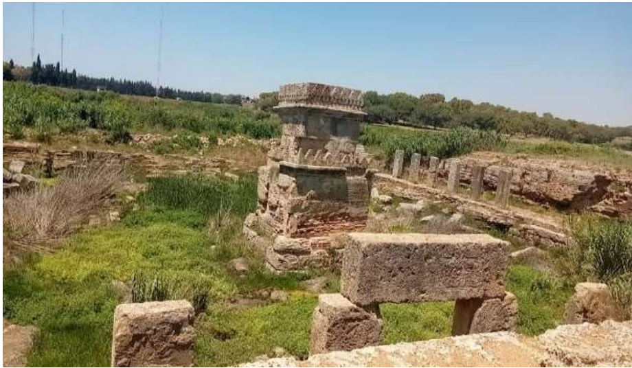
الصورة (1) معبد عمريت التراثي

المعبد: يشتهر المعبد بتصميمه الدقيق والفريد الذي يعكس ازدهار الحضارة في تلك الحقبة الزمنية، يضم المعبد حوضاً حفر في الصخر بأبعاد تقدر بـ 56.33 متر في الطول و 50.49 متر في العرض، مع بركة مائية يبلغ أبعادها 4838 x متراً، يتميز التصميم الداخلي برواق يحتوي على أعمدة مزينة بشرفات فنية، كما يحتوي المعبد على نبع الحياة المقدس في الجدار الشرقي، إلى جانب قنوات محفورة تستخدم لأغراض التطهير والشرب، إضافة إلى مصرف مياه في الجانب الشمالي، وكان مخصصاً لعبادة الإله القديم ملكارت الشافي من الأمراض، يتميز المعبد بالطقوس التي يؤديها الزوار حيث يطوفون حول الهيكل عبر الأروقة، وهناك تنويه من المؤرخ لوسيان عن وجود معبد مشابه في مدينة منبج (عميري، 1995، 145)، (الصورة 1).