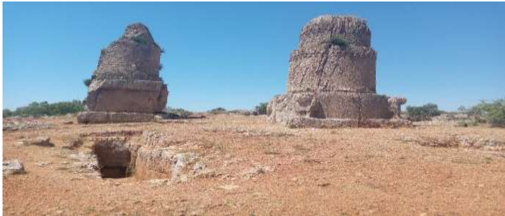
الصورة (2) مدافن عمريت

ملعب عمريت. تمت الحفريات بالقرب من الطريق الذي يربط طرطوس بطرابلس، ثم بناء المقبرة في العصر الفينيقي تقريباً في القرن الخامس قبل الميلاد واستُعملت مرة أخرى خلال الفترة الرومانية نحو نهاية القرن الثالث الميلادي (Massih, 2018, 381-382). المدافن: تتميز المدافن التي وُجدت في المدن الفينيقية بحجرات واسعة تم حفرها في الصخر، ويصل إليها عبر دهليز أو سرداب مع مدفن رأسي و هيكل يحوي جثمان الشخص المتوفى، في الفترة الفارسية-الفينيقية، تم تصميم القبور بحيث تفتح على الجدران الشاقولية للممر العمودي، وفي بعض الحالات، كانت المدافن مجرد فتحات في الصخر يتم تغطيتها بحجر فوق سطح الأرض، وتُلاحظ أيضاً وجود قبور جوفية في عمريت تحتوي على سراديب، وتتخللها نصب جنازية متميزة تعرف بالمغازل (حنة، 1992، 34-37)، ومن أهم هذه المدافن: (الصورة 2).