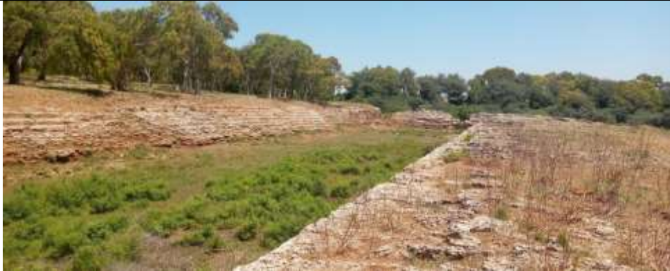
الصورة (3) ملعب عمريت

تاريخ الصورة 2024/7/1