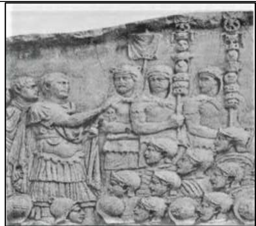
الصورة 1: يظهر عمود تراجان الإمبراطور وهو يخاطب قواته ومحاطاً بحاملي الرايات. (Schmöger, 2003, 514).