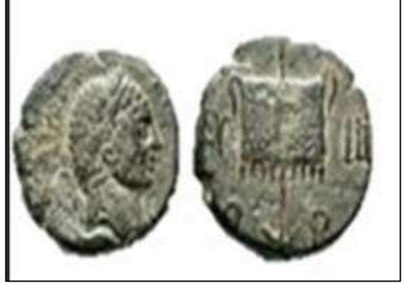
الصورة 13: مسكوكة من إصدار يعود لمدينة رأس العين بسورية. (كيوان، 2016، 20)