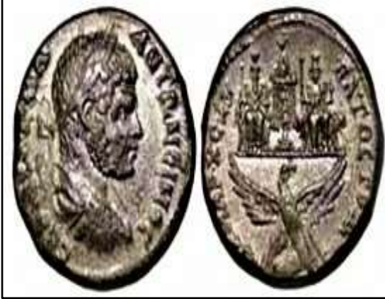
الصورة 14: تيترادراخما فضية صُنّدت في منبج. (كيوان، 2021، (200