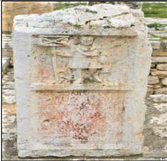
الصورة 12: شاهدة جنازية للأكويليفر وهو يحمل الراية والأكويلا بداخلها.