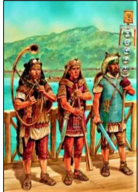
الصورة (3): تظهر نافخوا الأبواق بأدواتهم اللامعة وأنافتهم المتنوعة. (D'Amato, 2018, 43)