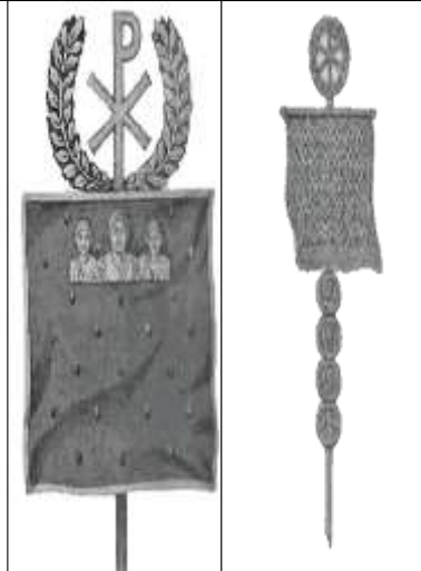
الصورة 7: توضح أشكال مختلفة للاباروم. (Schmöger, 2003, 532)