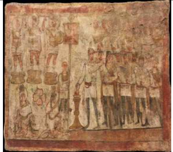
الصورة 11: تعرض لوحة التربيون من المعبد التدمري في دورا أوروبوس. (النفوري، 2016، 174)