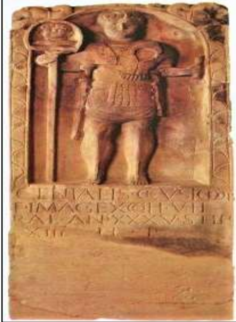
الصورة 10: شاهدة جنازية للإيماجينيفر (Goldsworthy, 2003, 56).