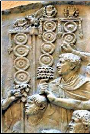
الصورة 8: تظهر أعمدة الرايات المزينة بأكاليل الورود (D'Amato, 2018, 5)