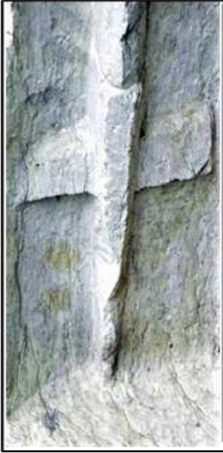
الصورة (5): تمثل قاعدة لراية تظهر عارضة عرضية تمنع انغراس الراية. (D'Amato, 2018, 20)