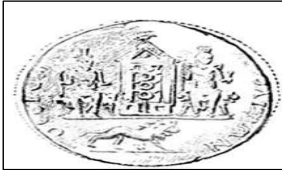
الصورة 15: الوجه الخلفي لتيترادراخما صادرة خلال حكم الإمبراطور كركلا. (كيوان، 2021، (200).

هذا البحث ممول من جامعة دمشق وفق رقم التمويل (501100020595).