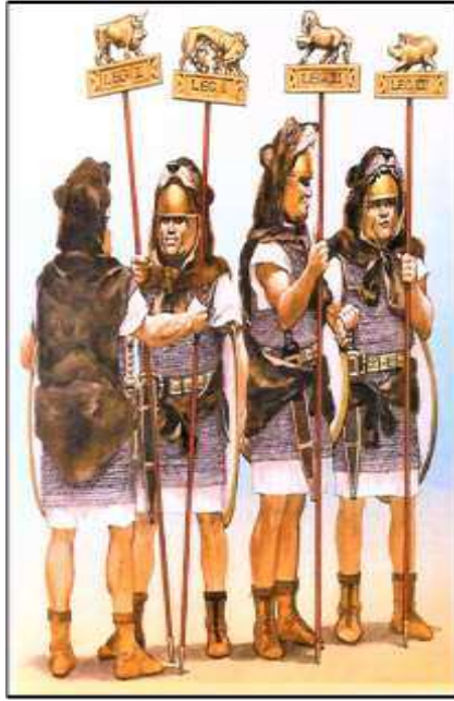
الصورة (4): أربعة من حاملي الرايات للجيش الجمهورية. (MCNAB, 2010, 29)