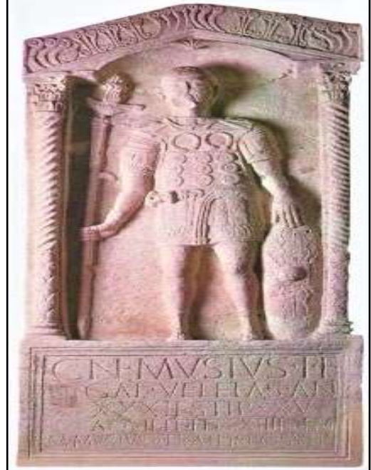
الصورة 9: شاهدة جنازية تمثل الأكويليفر (Goldsworthy, 2003, 96).